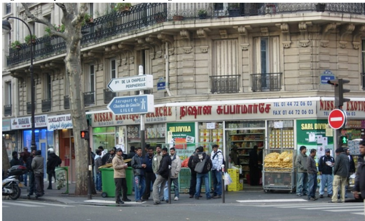
Figure 4. Un quartier-ressource pour ses usagers