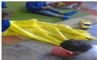
Figura 3 - Atividade cor amarela