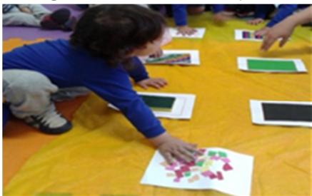
Figura 7 - Mural das sensações