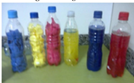
Figura 6 - Jogo de boliche

Dando sequência ainda ao eixo temático das cores, as crianças participaram da construção de um jogo didático com materiais reutilizados (jogo de boliche). A Figura 5 ilustra o jogo de boliche, em que cada criança teve a atribuição de colocar uma das cores em papel crepom dentro de sua respectiva garrafa pet.