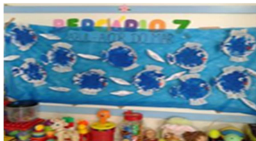
Figura 4 - Atividade cor azul