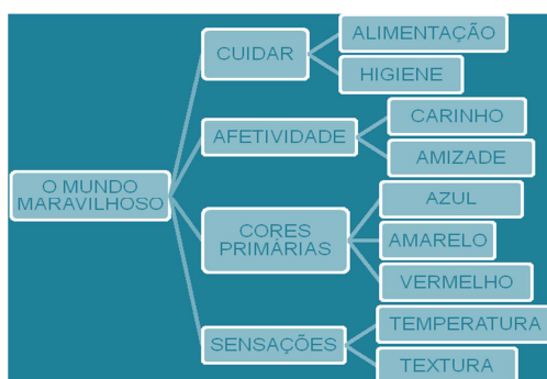
Figura 1 - Estrutura do projeto

Constatou-se, no relatório de estágio da acadêmica, que foi organizada uma rede temática para compor a proposta didática a ser desenvolvida ao longo das aulas. O tema central do projeto foi ‘mundo maravilhoso’. A partir dessa temática, a acadêmica selecionou quatro campos de experiências, denominados eixos temáticos: o cuidar, a afetividade, as sensações e as cores. A partir dos eixos, desenvolveram-se os temas e as atividades a serem abordadas em sala de aula. Dessa forma, a Figura 1 apresenta a proposta geral do projeto de estágio com os eixos temáticos e as temáticas priorizadas.