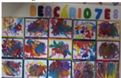
Figura 10 - Painel das cores

Percebeu-se, no relato de estágio, conforme os eixos temáticos iam sendo propostos, como os demais iam se agregando ao próximo eixo. Desse modo, durante todas as oportunidades em que as crianças estavam envolvidas, retomavam-se os eixos anteriores. Assim, à medida que a criança se alimentava, por exemplo, com uma banana, gelatina, sucos, ou mesmo durante a escovação dos dentes, paralelamente elas iam mencionando as cores dos objetos. “[...] os conhecimentos parcelados apenas servem para a utilização técnica. Eles não chegam a conjugar-se para alimentar um pensamento que possa considerar a situação humana” (MORIN, 1999, p.17).