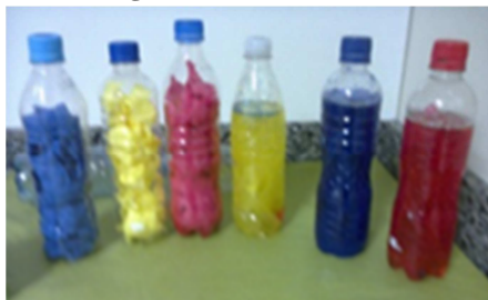
Figura 6 - Jogo de boliche

Dando sequência ainda ao eixo temático das cores, as crianças participaram da construção de um jogo didático com materiais reutilizados (jogo de boliche). A Figura 5 ilustra o jogo de boliche, em que cada criança teve a atribuição de colocar uma das cores em papel crepom dentro de sua respectiva garrafa pet.