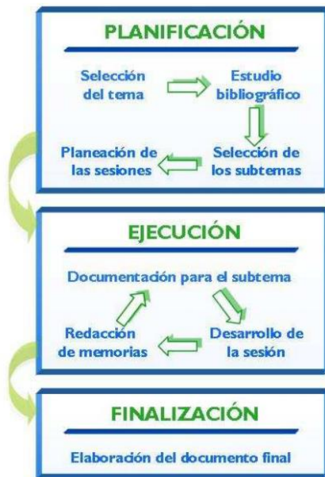
Figura 2. Esquema metodológico del Seminario de Investigación.

Como se menciona anteriormente, se llevarán a cabo una serie de sesiones, donde se presentarán los conceptos principales y se pondrán en el contexto de la investigación, desarrollando las etapas que se presentan en la Figura 2 y se detallan en los siguientes apartados. Para esto, se tendrá en cuenta los lineamientos establecidos en la metodología del seminario alemán (Cadena-Díaz, n.d.; Universidad de Valencia, n.d.).