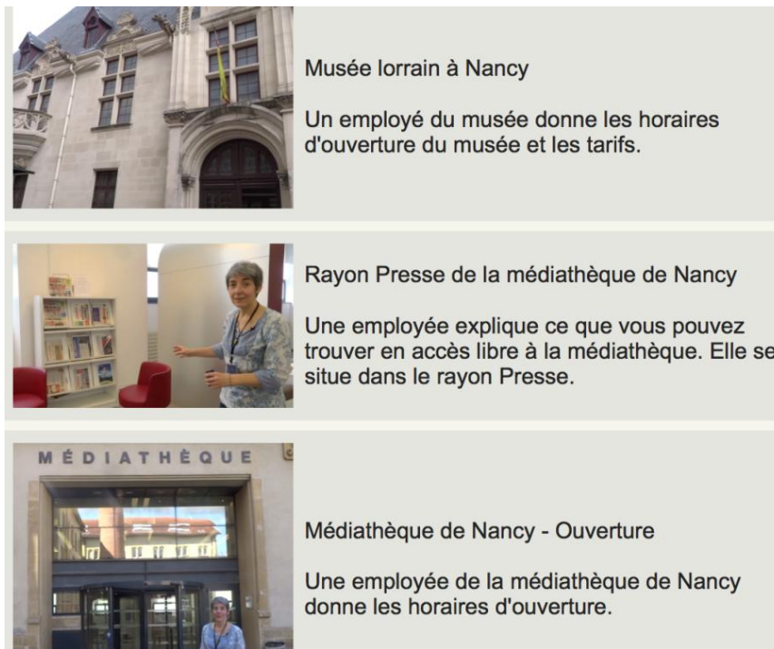
Figure 3 : Titres et résumés de ressources du corpus

Lors d'une expérimentation du site FLEURON, des étudiants nous ont mentionné l'importance du choix des titres et des résumés. Nous y reviendrons dans le point suivant.