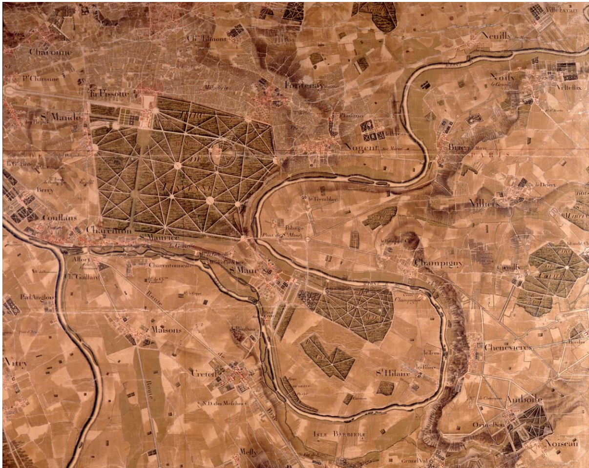
Illustration 1 : Extrait de la carte des Chasses, réalisée entre 1768 et 1774 pour Louis XV.

tout grand du royaume se doit de posséder. Dès cette époque, intervient un processus de mimétisme. La noblesse de robe ou les riches bourgeois disposent d'une terre de villégiature en complément de leur résidence parisienne. En bord de Marne, c'est le site paysager et la perspective qui sont investis. La rivière, non encore canalisée et donc sujette à de nombreuses inondations, constitue une barrière, une protection mais aussi un obstacle. Elle n'est bordée que de pâturages ou de prairies. Les demeures dominent les versants et les jardins s'étagent vers les rives, organisant parfois la perspective jusqu'aux îles, restées sauvages.