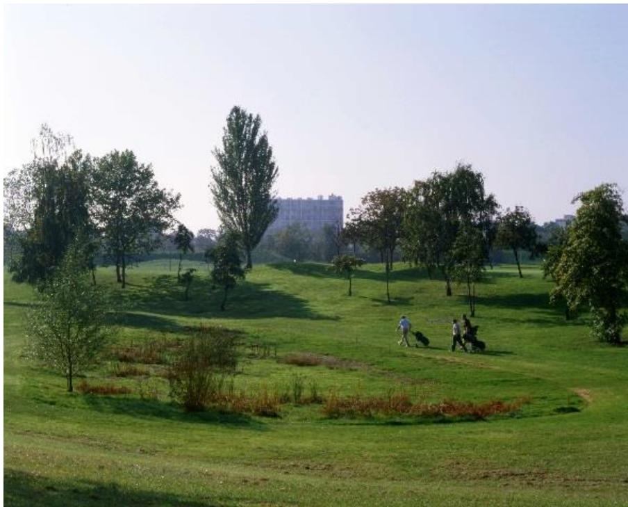
Illustration 4 : Le parc interdépartemental du Tremblay à Champigny-sur-Marne.

Non loin de là, le domaine du Tremblay à Champigny 25 , attesté au XVIIIe siècle, connaît un destin mouvementé. Si la maison des champs et son jardin sont modestes, les terres agricoles qui les complètent couvrent plus de 150 hectares. Le dépeçage commence au milieu du XIXe siècle. Puis une société immobilière acquiert des vastes terres à la fin du XIXe siècle, organise encore l'urbanisation d'une vingtaine d'hectares par des opérations de lotissement et en loue soixante quinze autres à la société des Sports de France. Cette dernière y construit un hippodrome, inauguré en 1906. Durant les années 1960, les pouvoirs publics projettent de reconverter l'équipement en un vaste parc sportif destiné notamment aux Parisiens. On s'empresse de détruire les superbes bâtiments et d'araser le terrain... puis le projet, mal conçu et au cœur d'enjeux politiques complexes, est abandonné ! Il faut attendre quelques décennies pour que le terrain, laissé en friche, ne devienne le plus vaste des parcs interdépartementaux autour de la capitale.