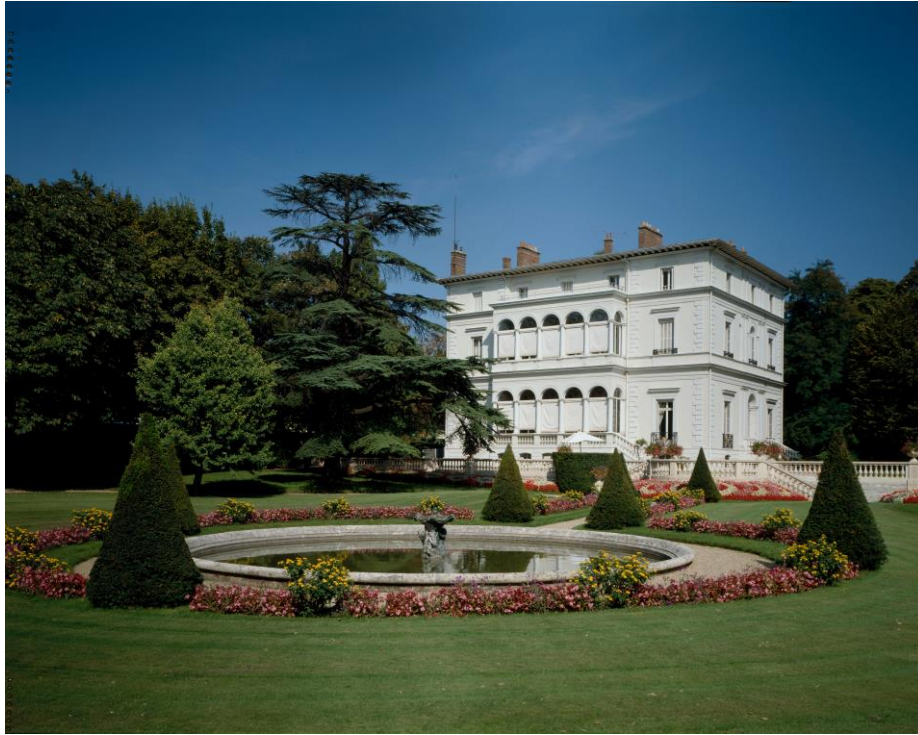
Illustration 3 : Créteil, vue du parc du château des Mèches.