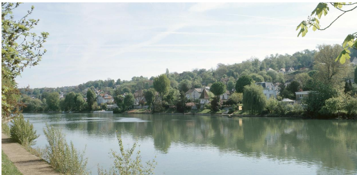
Illustration 5 : Les coteaux de Chennevières-sur-Marne.