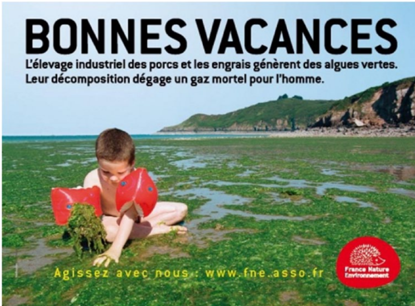
Image 4. Campagne de publicité France Nature Environnement 2011.

entrée sur le terrain du terre-mer, l'analyse du traitement public et collectif de l'impact des activités humaines et agricoles sur l'environnement et la biodiversité marine, permet le refroidissement théorique nécessaire pour saisir la crise écologique et sociale contemporaine de manière tangible dont l'extension globale et durable du phénomène d'eutrophisation constitue un révélateur, en regard de la prolifération des références à la soi-disant soutenabilité (Kates, 2011) des socio-écosystèmes côtiers et marins. L'eutrophisation permet ainsi d'aborder les relations entre savoir (science, connaissances profanes, hybridation), pouvoir (décision, politique, autorité) et avoir (marché, économie, industrie) particulièrement épineuses le long du continuum terre-mer en raison de la très forte pression anthropique et de sa vulnérabilité face au changement global (voir images 4 et 5).