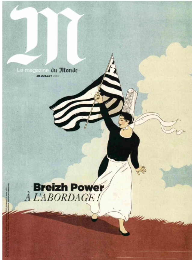
Image 5. Couverture du magazine du Monde . 20 juillet 2013.

De là, certains membres de l'équipe du LEMAR embarqués dans ApoliMer, ont réalisé des missions exploratoires en Amérique du Nord (Californie, baie de San Francisco) et en Chine (Qingdao, baie de Jiaozhou) avec un regard comparatif avec la situation en Union européenne (ZABrI) pour démêler les liens entre science et politique dans ces trois contextes. Des extraits de carnets de terrain de ces missions sont ici présentés. Au fil des ans, les chercheurs d'ApoliMer ont mené, mènent, et envisagent d'autres projets de recherche sur les mers du globe, guidés par les anciennes grandes expéditions de l'Académie de Marine[5] qui quittèrent Brest les siècles passés à destination de contrées lointaines (voir images 10 et 11).