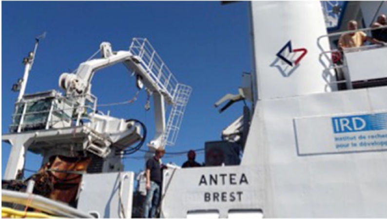
Image 18. Campagne scientifique « SPM 2017 » – Antéa, août 2017.

des enjeux environnementaux par rapport à d'autres considérations (économiques, sociales, stratégiques, symboliques). Cette petite équipe interdisciplinaire interagit à la fois avec les chercheurs en sciences de la nature et les élus, les gestionnaires et les acteurs économiques de SPM, au niveau local (Maire), territorial (Collectivité territoriale) et national (Ministre des outre-mers venus avec son staff pour le lancement des Assises de l'Outre-Mer en octobre 2017, présence à ce moment-là de l'armateur Le Garrec). »