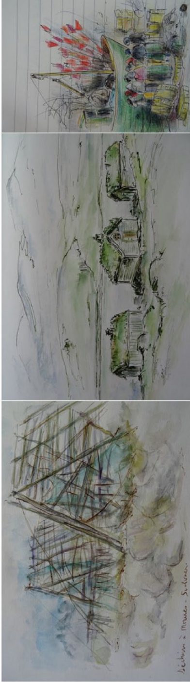
Image 11. Carnets de terrain, Norvège et Pologne, aquarelle et encre de chine sur carnets papier, 2015.