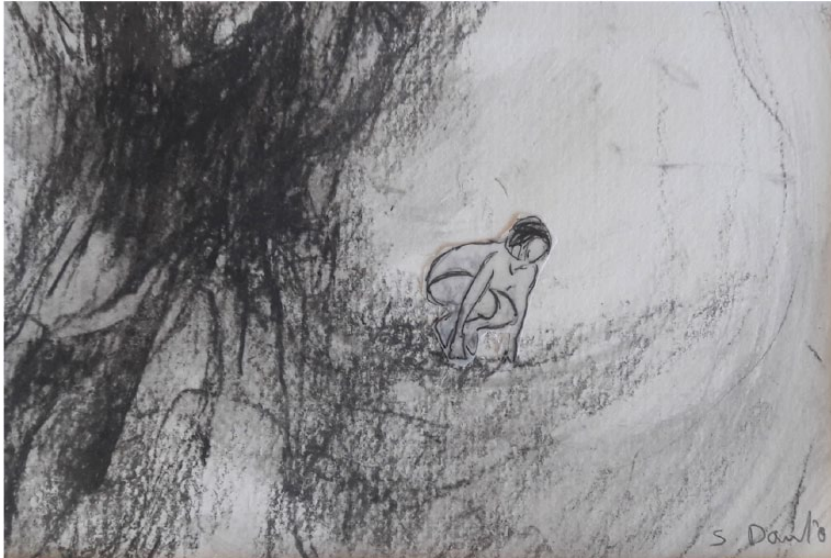
Image 1. Relation Homme / Nature. Fusain, 2013.