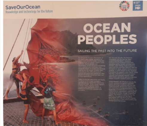
Images 6 et 7. Assemblée générale des Nations-Unies, Conférence mondiale sur l'Océan (ODD 14) juin 2017.