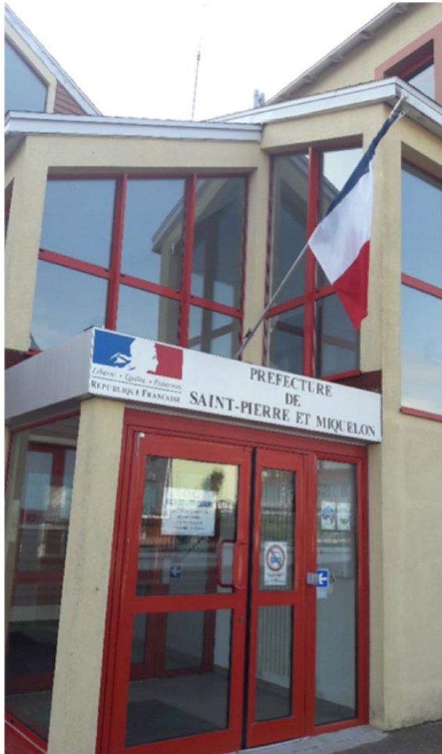
Image 19. Préfecture à Saint-Pierre et Miquelon. Aout 2017.

majoritairement grâce aux aides de l'Etat et aux fonds européens, ainsi qu'à un système fiscal propre à Saint-Pierre inauguré en 1946. De la Doris qui a révolutionné la pêche à la morue sur les bancs de Terre-Neuve au Keravel, bateau le plus polyvalent de SPM dans sa catégorie (chalutier, ligneur, palangrier hydraulique mais aussi dragueur), jusqu'à la nouvelle filière d'exploitation du « concombre de mer », très prisée sur le marché asiatique, pêchée au large de l'archipel, traitée sur le territoire puis au Canada avant d'être exportée (voir image 20).