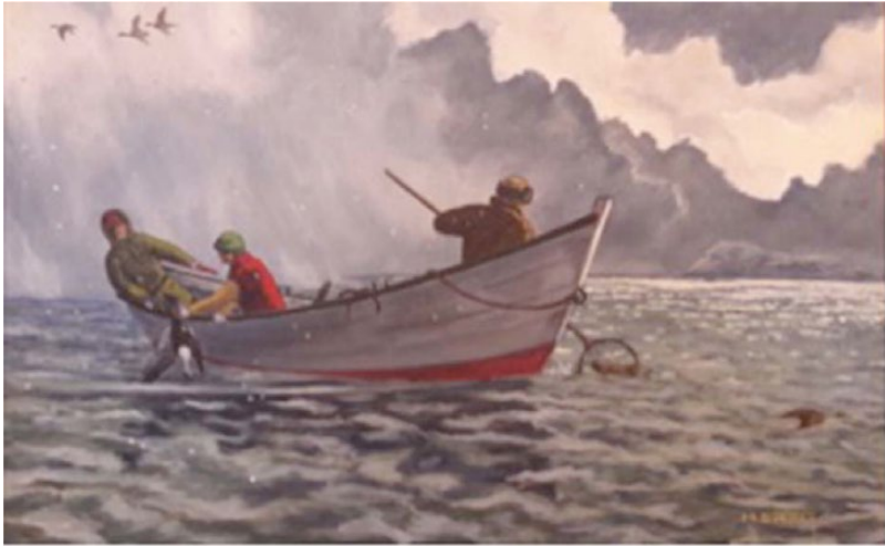
Image 21. Peinture photographiée dans les locaux de la Collectivité territoriale de Saint-Pierre et Miquelon, août 2017.

Les observations ethnographiques, dont seulement quelques extraits ont été ici présentés, constituent un matériau de premier choix pour conduire notre analyse critique : le