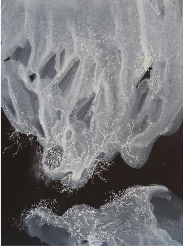
Image 16. Glaciation, aquarelle et crayon sur papier, 2015.