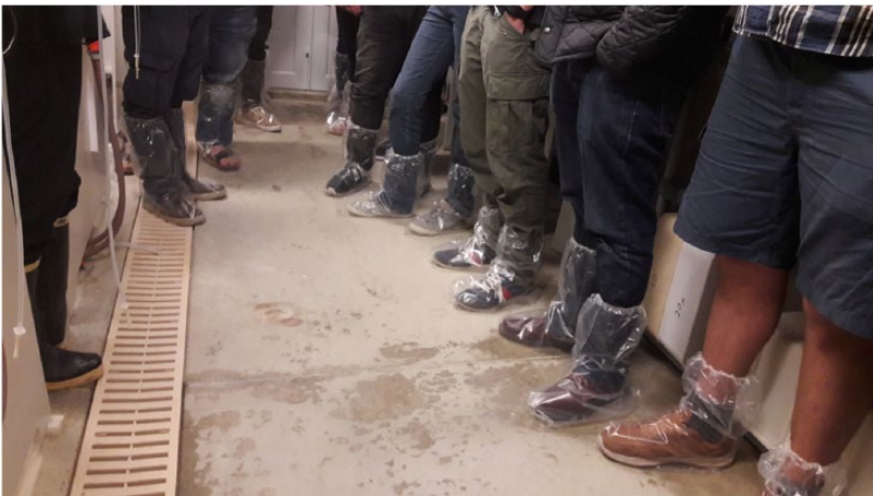
Images 8 et 9. Visite ethnographique du site expérimental d'Argenton. Laboratoire de Physiologie des Invertébrés - Département de Physiologie des Organismes Marins. Ifremer, LEMAR (UMR 6539).