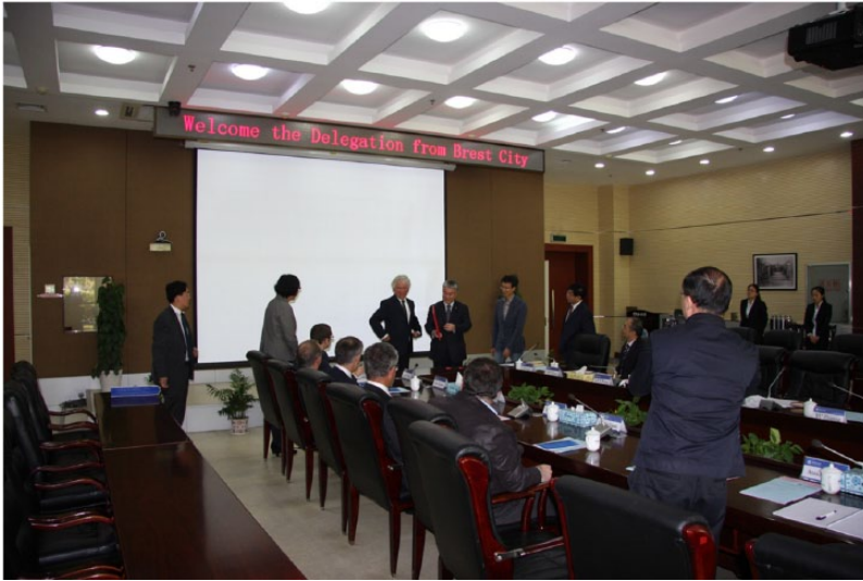
Image 13. Accueil de la délégation brestoïse à l'Université océanique de Chine, Qingdao, Mission Jeanne d'Arc mai 2015.

l'eau, favorisant par là-même le maintien de populations de phytoplanctons sains (diatomées). Nous avons donc affaire à une véritable expérience à l'échelle de la baie, dont les scientifiques vont pouvoir profiter pour tester in vivo leurs hypothèses, en observant sur plusieurs années, la réponse du phytoplancton et de toute la chaîne alimentaire à ces modifications dans la qualité et la quantité des nutriments apportés à la Baie.