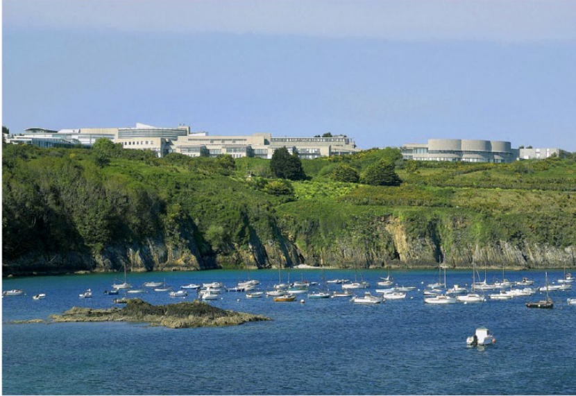
Image 2. IUEM vu de la rade.