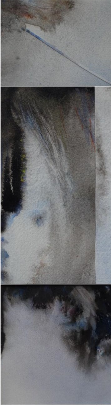
Image 14. Lumière du Nord / Petite vague / A la pointe, aquarelles et encres de chine sur papiers Arches, 2015–2017. Credit : © Sylvie Allais-Danto.