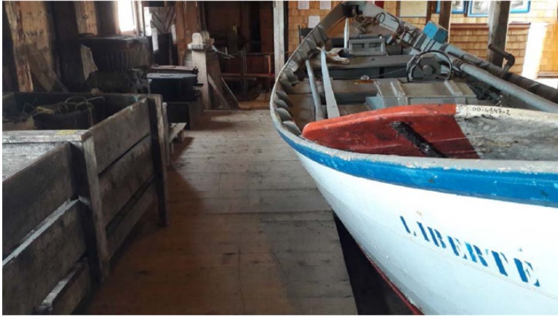
Image 20. Evolution de la pêche à Saint-Pierre et Miquelon.

Cette dépendance économique vis-à-vis de la métropole est particulièrement mal vécue à Saint-Pierre et Miquelon qui craint en permanence une réduction de ces aides indispensables à sa survie provoquant ainsi une véritable volonté des pouvoirs publics de promouvoir le secteur du tourisme ainsi que le développement numérique et des services au sein de ce territoire.