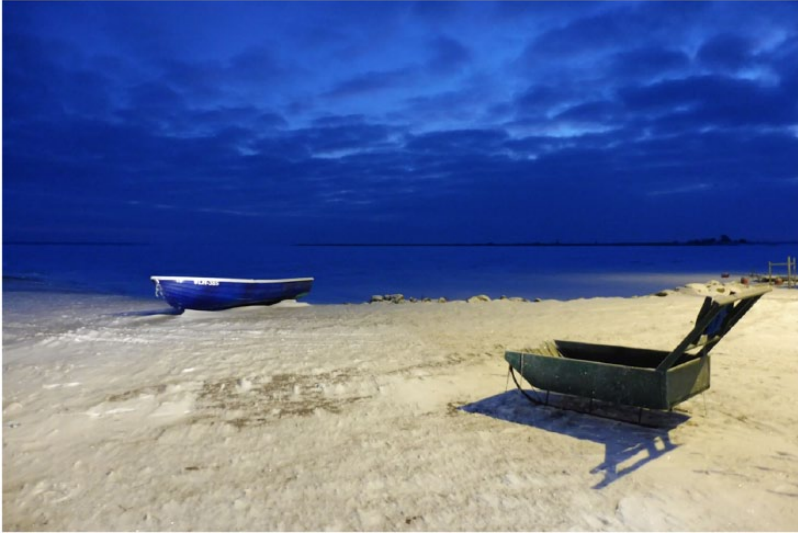
Image 17. Le départ à la pêche sur la glace approche, île de Kihnu, Estonie, 2016.

Son 3 : DakhaBrakha, Yanky, Ethno-mécanique [ДахаБраха, Янки, Этномеханика], 2010.