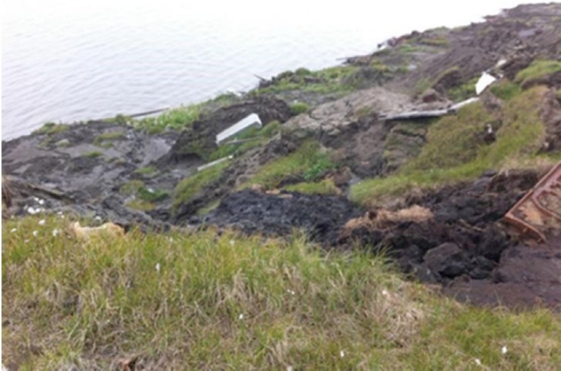
Image 15. Cimetière de Bykovsky près de Tiksi (Sibérie), 2014.

comme socio-économiques, des communautés côtières, y est aussi questionnée, notamment sous le prisme des trajectoires des pays post-socialistes et post-soviétiques.