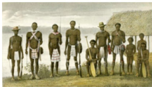
Fig. 3: A.M. Coster, De Boschnegers in de Kolonie Suriname , watercolour, 1866.

Une autre configuration des rapports d'assimilation entre colons européens et indigènes afro-amérindiens réside dans la dépendance trophique des enfants des maîtres blancs vis-à-vis de leurs nourrices de couleur. Elsa Dorlin rapporte dans La matrice de la race que cette promiscuité demeure absente des registres officiels, parce qu'elle suscitait le doute à propos de la pureté des Blancs originaires des colonies (Dorlin, 205-206). Étonnamment, la scène assez répandue des nourrissons blancs tétant le sein d'une ayah ou "Da" noire – ce dernier terme étant plus usité aux Antilles françaises – a été maintes fois rapportée par des chroniqueurs et voyageurs de passage aux colonies. Cette pratique, qui était censée immuniser les bébés contre la malaria valaient à ces derniers leur lot de suspicion et d'opprobre une fois