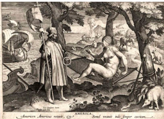
Fig. 1: Jan Van Der Straet, America , ink on paper, 200 x 269 mm, British Museum.

Il existe une gravure célèbre qui permet de saisir le mélange d'attirance, de peur et de dégoût qui habite le "regard euro-centrique" des conquistadors. Cette estampe, qui s'intitule America , met en scène la première rencontre coloniale. Elle a une longue histoire. Son auteur, le peintre-dessinateur flamand Jan Van der Straet, n'a en fait jamais visité les Antilles, mais il a créé une œuvre d'art intemporelle qui a durablement imprégné la colonialité esthétique par son caractère narratif.