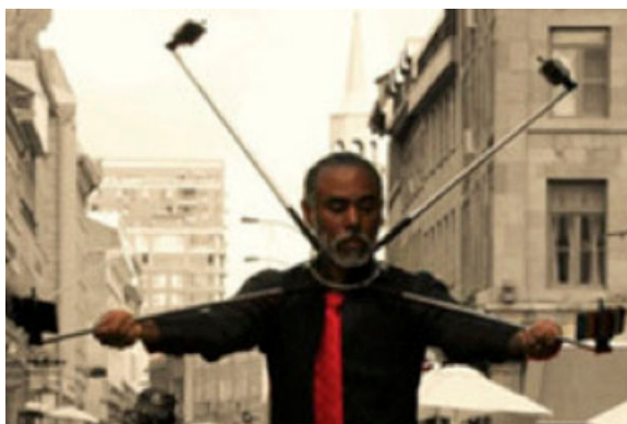
Fig. 6 : Eddy Firmin, performance in Montreal, 4 March 2017.

Les performances de l'artiste guadeloupéen Eddy Firmin offrent un exemple intéressant de la manière dont le détournement du nexus colonial peut être employé pour revivifier l'imaginaire esthétique. Dans sa vision créolisée de la mondialisation, Firmin montre que la colonialité s'est infiltrée dans la logique moderne du capitalisme. Sa marche du 4 mars 2017 à Montréal a d'ailleurs joui d'une couverture médiatique très appréciable, l'ironie dramatique voulant qu'il cible précisément par son acte les excès du néolibéralisme dont les nouveaux média se font le relais à leur insu. Le message de