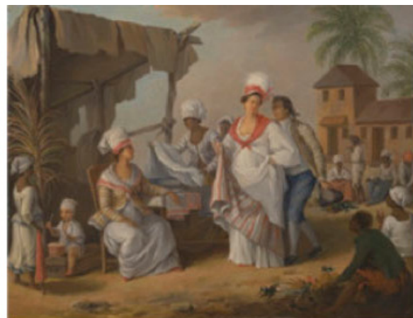
Fig. 5: Agostino Brunias, Market Day, Roseau, Dominica , oil on canvas, 356x464 mm, 1780. Yale Center for British Art.

• La densification : la réalité du sujet esthétique postcolonial est, en comparaison avec son homologue colonial, étalagée. Pour gagner en densité et en force signifiante,