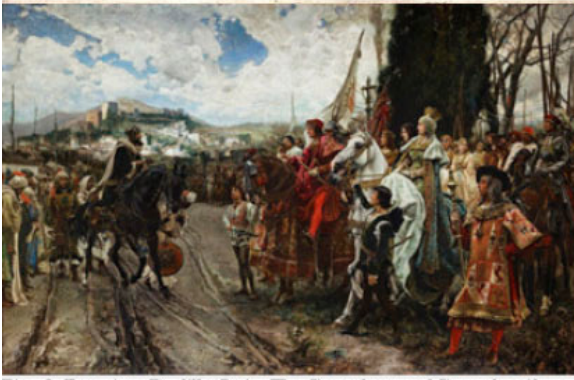
Fig. 2: Francisco Pradilla Ortiz, The Capitulation of Granada , oil on canvas, 330 x 550 cm, 1881, Palace of the Senate, Spain.

se transformera en théâtre d'une colonialité sisyphéenne qui ne se repose jamais.