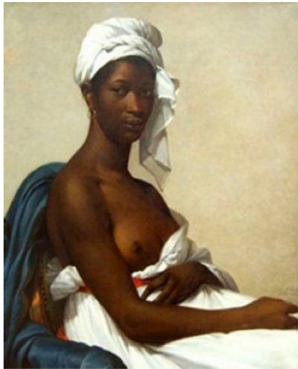
Fig. 4: Marie-Guillemine Benoist, Portrait d'une négresse , huile sur canvas, 81x 65 cm, 1800.

L'artiste française Marie-Guillemine Benoist était au fait de ces contradictions lorsqu'elle composa son Portrait d'une négresse en 1800 . Sous ses habiles coups de pinceaux, la critique du régime colonial sévissant aux Amériques françaises s'opère dans la douceur et la subtilité. Par un traitement délicat des tonalités brunes de la peau, l'artiste se montre solidaire de la condition féminine racialisée en exécutant un portrait d'un grand réalisme, sans pour autant verser dans l'exotisme. Elle touche ainsi aux contradictions de la République qui, dans son grand élan humaniste, n'a pas étendu ses largesses aux esclaves des colonies. Cette femme noire anonyme, d'une grande beauté, au port