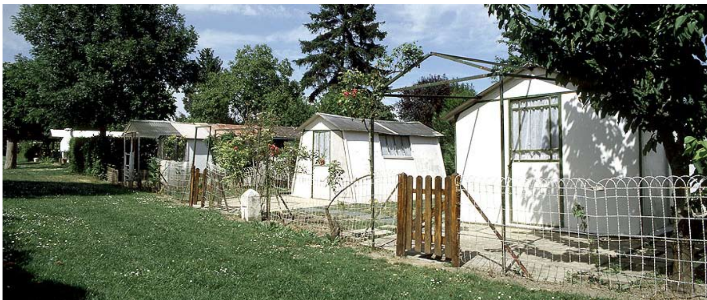
Physiopolis durant une journée de semaine de l'automne 2000 ; des bungalows encore parfaitement entretenus.