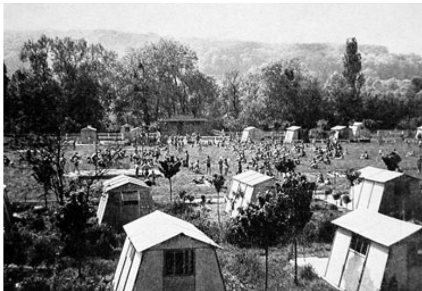
Séance de gymnastique sur le grand stade Durville au début des années 30.

Quels sont ces gens qui vivent ensemble quasiment nus ? En 1929, les Durville souhaitent même créer un stade de nu intégral si les pouvoirs publics les y autorisent ; cependant, très vite, devant le vif débat qui s'engage ils préfèrent temporiser plutôt que de risquer de perdre des adeptes. Pour éviter tout souci avec les autorités, les tenues sont clairement réglementées ; « dans les endroits inaccessibles à la vue, la tenue minimum autorisée comprend un slip couvrant les parties sexuelles et les fesses ainsi qu'un cache-seins pour les femmes. Les teintes claires ou blanches sont interdites [car elles évoquent trop les sous-