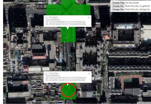
FIG. 2: État réel du trafic