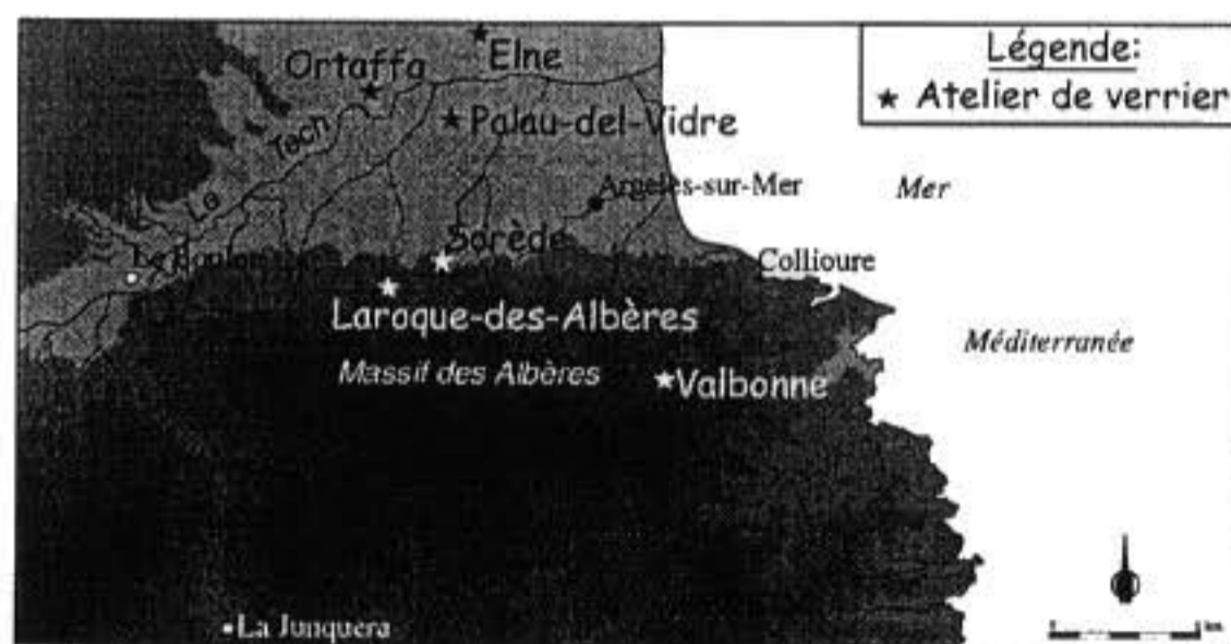
Fig. 2.- Localisation des ateliers de verriers dans la basse vallée du Tech et le massif des Albères au Moyen Âge (XIV e -XV e siècles).

En ce qui concerne la période médiévale, on peut noter en guise de conclusion la prééminence du village de Palau-del-Vidre sur la production ver-