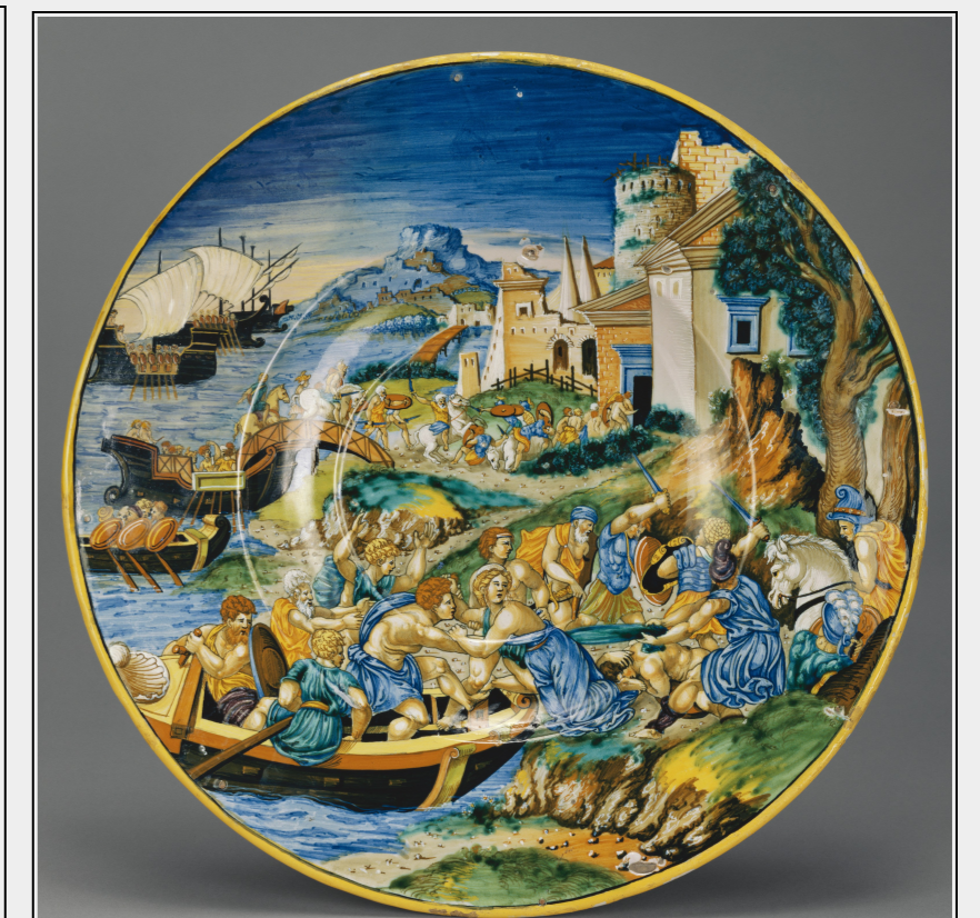
Fig. 2 : Xanto Avelli, 1534, Urbino, J. Paul Getty Museum.