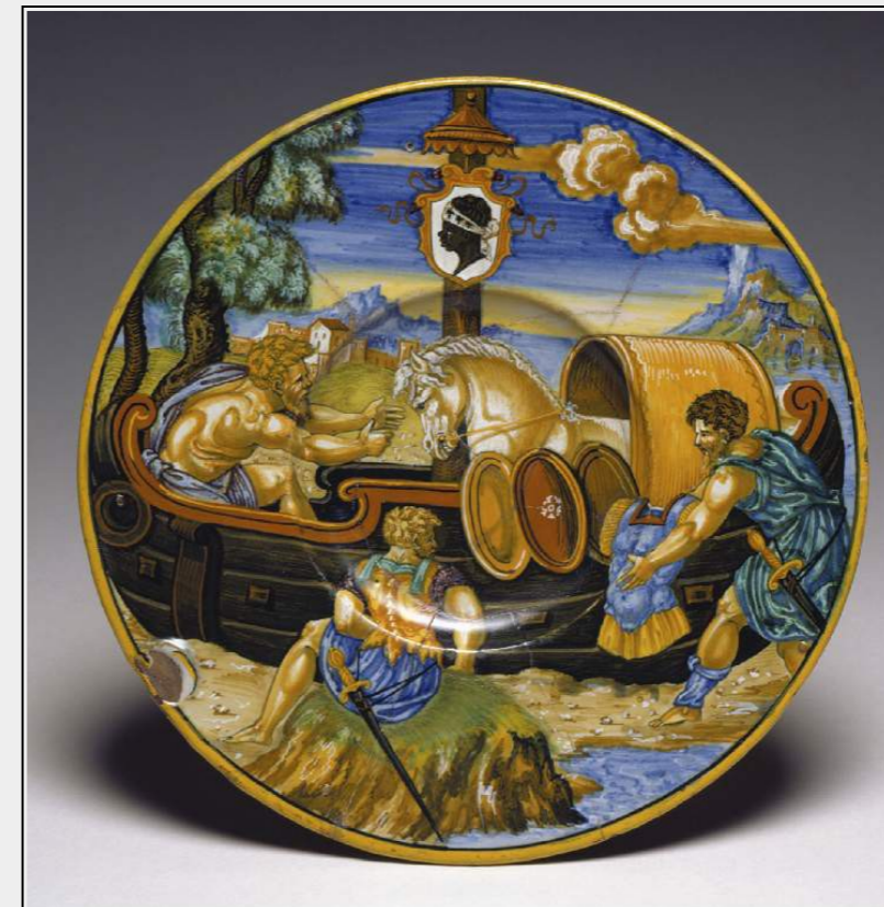
Fig. 1 : Xanto Avelli, 1532, Urbino, Fitzwilliam Museum.

La comparaison des deux majoliques souligne ainsi l'art de l'assemblage propre à Xanto : un patchwork littéraire et formel empruntant aux chefs-d'œuvre des grands artistes du Cinquecento adaptés à différents sujets, métamorphosant les grands poètes italiens en Homère et Ovide de leur temps, et contribuant finalement à diffuser ce nouveau langage.