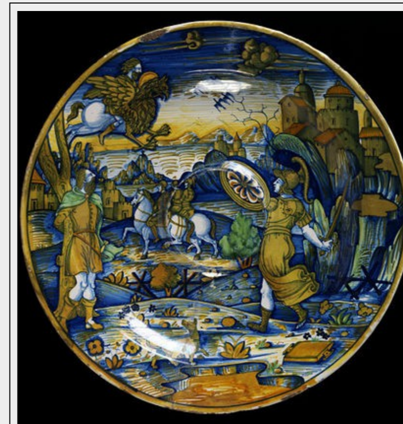
Fig. 3 : Giacomo Mancini, 1545, Deruta, V&A Museum.

Cette lecture moralisante se superposant à la narration proprement dite fait entrer en dialogue image et texte, d'autant plus que le revers de la pièce cite partiellement le commentaire allégorique : la majolique devient ainsi une mise en abîme de l'édition illustrée qu'elle interprète, un support autonome potentiel aux discussions courtoises de l'entourage de son commanditaire et, in fine , un signe visuel d'un nouveau langage naissant.