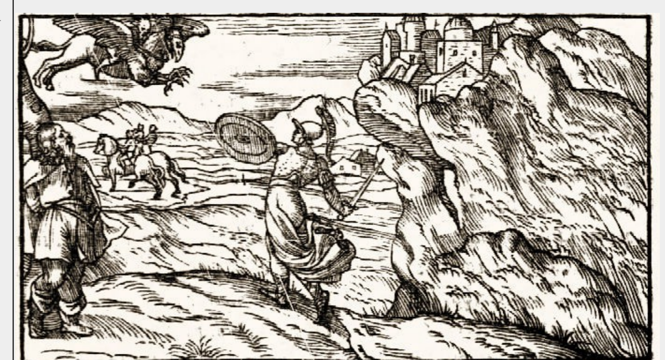
Fig. 4 : détail, chant IV, Orlando Furioso, édition Giolito, 1542.