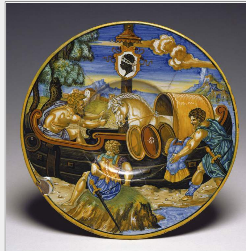
Fig. 1 : Xanto Avelli, 1532, Urbino, Fitzwilliam Museum.

La comparaison des deux majoliques souligne ainsi l'art de l'assemblage propre à Xanto : un patchwork littéraire et formel empruntant aux chefs-d'œuvre des grands artistes du Cinquecento adaptés à différents sujets, métamorphosant les grands poètes italiens en Homère et Ovide de leur temps, et contribuant finalement à diffuser ce nouveau langage.