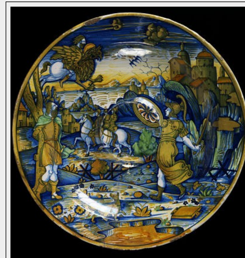
Fig. 3 : Giacomo Mancini, 1545, Deruta, V&A Museum.

Cette lecture moralisante se superposant à la narration proprement dite fait entrer en dialogue image et texte, d'autant plus que le revers de la pièce cite partiellement le commentaire allégorique : la majolique devient ainsi une mise en abîme de l'édition illustrée qu'elle interprète, un support autonome potentiel aux discussions courtoises de l'entourage de son commanditaire et, in fine , un signe visuel d'un nouveau langage naissant.