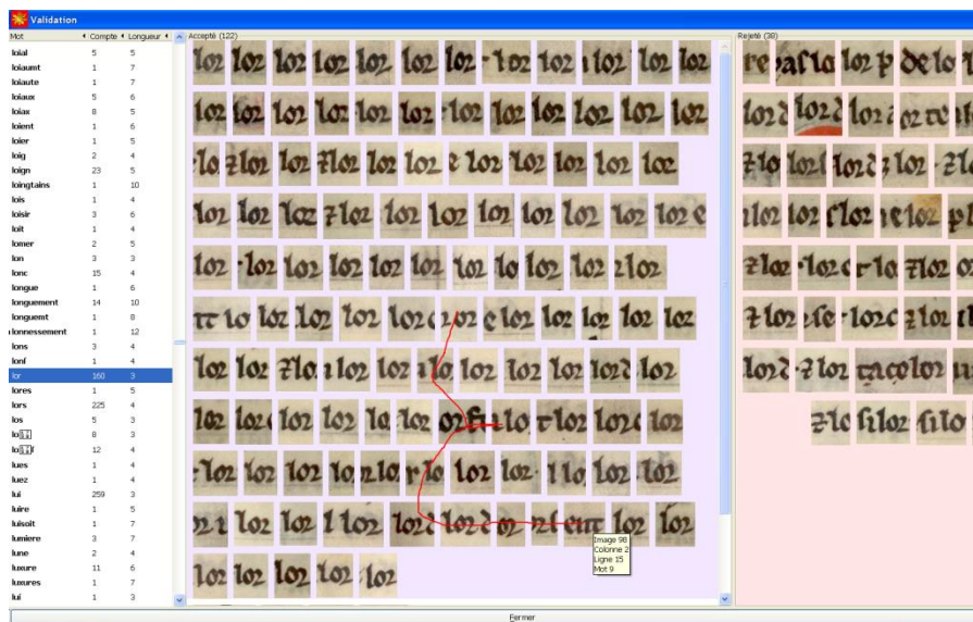
Figure 3 : Interface de validation de l'alignement texte-image (logiciel développé par Y. Leydier et le LIRIS dans le cadre du projet ORIFLAMMS)