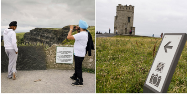
Illustration 4. Slieve League, série Paysages du Tourisme irlandais

Dans les images-clichés, la mise en scène est particulièrement maîtrisée. Le paysage éclairé est celui des masques et des bergamasques , nous aurait soufflé Verlaine. Il est avant tout celui de la représentation sociale, d'une doxa de l'image. Nuances et émotions s'effacent au profit d'un répertoire social codifié en stéréotype, auquel il est difficile d'échapper. Il existe une ironie mensongère du paysage codifié qui impose non seulement une image mais un schéma de comportement. « Le sentiment confortable que le monde se trouve dans cet ordre où elle les englué, les fruste de ce bonheur qu'elle présente trompeusement. L'effet d'ensemble de l'industrie culturelle est celui d'une anti-démystification [...] à savoir la domination technique progressive se mue en tromperie » (Adorno, 1964).