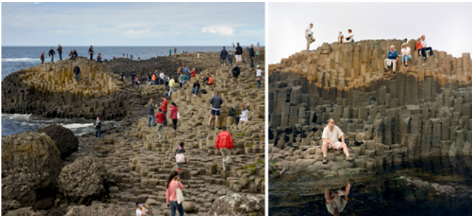
Illustration 5. La Chaussée des Géants, série Paysages du Tourisme irlandais (P. J. Jehel)

La photographie en stéréotype n'ouvre pas sur un univers sensible particulier, mais sur une identification. Celle d'une appartenance au groupe qui est venu à un endroit et qui peut en témoigner par l'image (ill. 5). Elle est une preuve de sa visite. Comme dans la fable de La Fontaine, le pigeon épris de voyage souhaite pouvoir dire « j'étais là ; telle chose m'advint » 1 . Les « paysages touristiques » photographiés et mis en ligne témoignent d'une expérience qui n'a rien de personnel. Il s'agit plutôt d'un « prêt-à-photographier » où les paysages peuvent être reconnus dans une doxa visuelle. Ils s'approchent du mythe au sens où Roland Barthes (1970) écrivait « le mythe est une parole » : il est un système de communication, un message lié à une certaine société à un moment précis de son histoire.