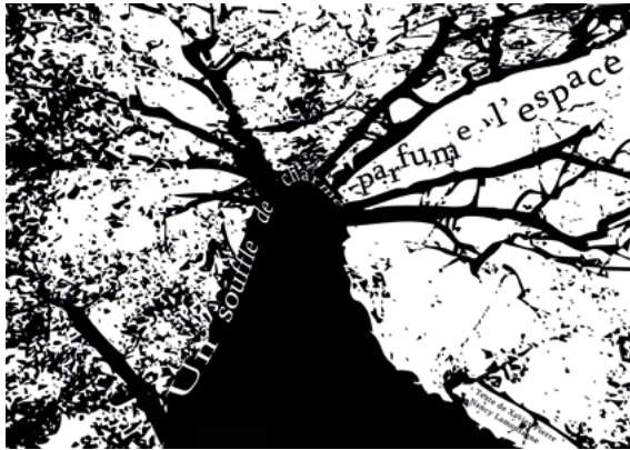
Illustration 8. « Charmes » de l'installation Paysages (N. Lamontagne)

Quand l'image traque l'ambiguïté de lecture comme dans l'illustration 8, l'artiste sème le doute. Le visuel déclenche les associations d'idées, l'arbre devient un lacs de chenaux entrecroisés. La classification échoue, les typologies s'effacent. Quand « la praxis entière de l'industrie culturelle applique carrément la motivation du profit aux produits autonomes de l'esprit », c'est « l'autonomie des œuvres d'art » (Adorno, 1964) et l'espace en représentation qui est en péril.