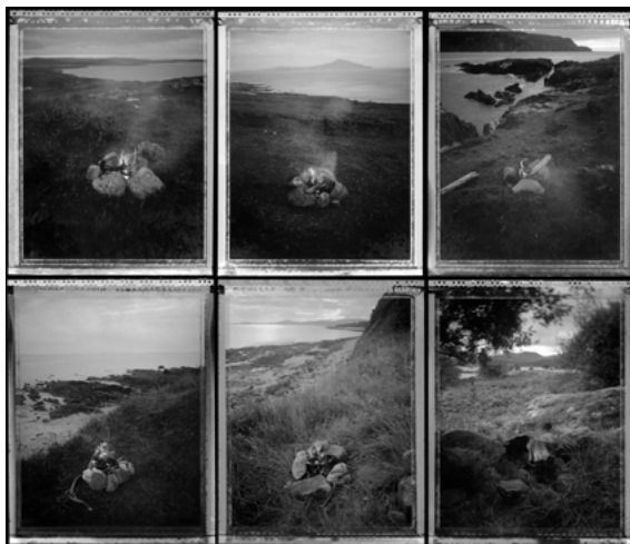
Illustration 3. Série Feux d'Irlande (P. J. Jehel)

Dans la série Feux d'Irlande (ill. 3), la promenade est douce, sans effet. Le rivage apparaît comme une silhouette polymorphe, hauteur dominant la mer, plateforme séparant la terre de la mer, dédale de rochers et d'écueils battus, jardins d'îlots intérieurs. Une nouvelle carte du monde se dessine. Le mouvement photographique laisse au regard des fragments d'un temps qui n'est déjà plus. Passager clandestin du mouvement, embarqué avec sa machine à arrêter le temps, le regard s'échoue au grès du rivage et capte l'instant sensible, le temps de l'émotion.