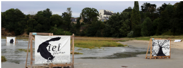
Illustration 7. Installation Paysages (N. Lamontagne)