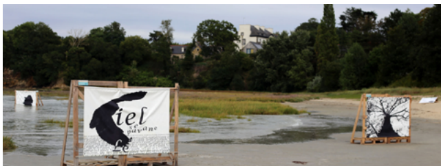
Illustration 7. Installation Paysages (N. Lamontagne)