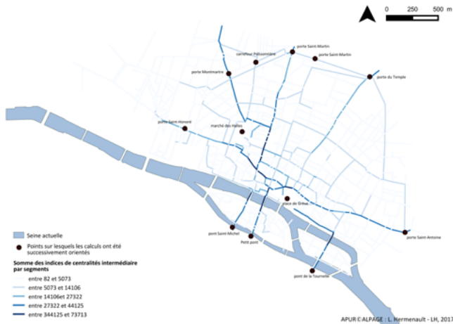
Figure 2. Filaire des voies au début du XVIII e siècle pondéré par les indices de centralités intermédiaires de chacun des tronçons

Autrement dit, une fois cartographiées, la confrontation des données documentant la dimension concrète de l'espace et celles permettant de poser des hypothèses sur les mobilités intra-urbaines permet de dessiner des espaces aux logiques de fonctionnement variées au sein de l'ensemble urbain, et donc probablement aux dynamiques économiques différentes : certains quartiers sont par exemple littéralement organisés par les activités commerciales et/ou artisanales, quand d'autres le sont moins. L'étude des formes composant le tissu permet de déceler des sous-ensembles dans le territoire urbain, que la représentation des divisions internes historiques classiques (limites des censives par exemple) ne révèle pas.