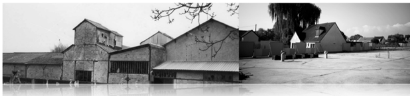
1a. bâtiments de l'usine visibles depuis le cimetière voisin