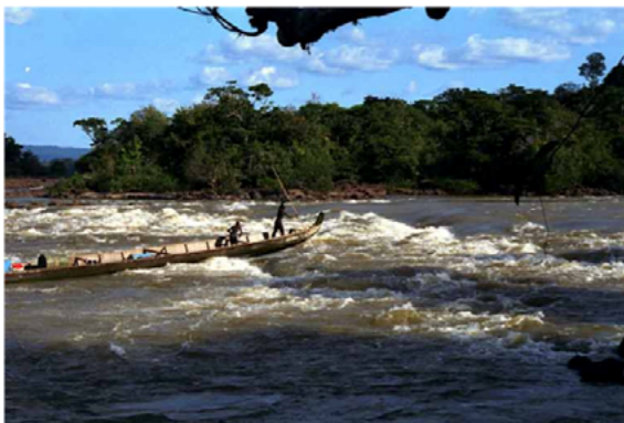
Figure 1. Pirogue franchissant les sauts à l'aide d'une perche ( kula ) (François, 2003)

Dans un second cas (2), des St-Laurentais maintiennent des maisons dans leur konde , leur village d'origine, situé beaucoup plus amont du fleuve, là aussi sur la rive surinamaïse. Pour ces personnes, le konde n'est ni un espace de production agricole, ni un espace de repos : il est fréquenté pour des raisons culturelles, lors des cérémonies funéraires. Là aussi, le groupe formé par les maisons des descendants en ligne matrilineaire d'une aïeule constitue un lieu de production de liens de parenté, qui peuvent être réactivés en contexte urbain.