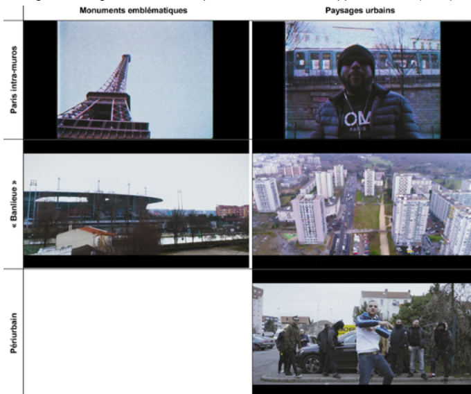
Figure 2. Images extraites du clip « Grand Paris », du rappeur Médine (2017)