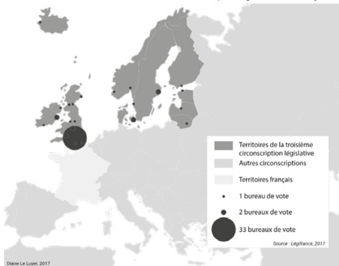
Figure 2. Territoires et bureaux de votes de la troisième circonscription législative des Français de l’étranger

Au-delà de l’abstention, légitimable par l’expatriation en elle-même, on observe une inconscience du système même de représentation électorale et un manque de sentiment d’appartenance à la circonscription consulaire ou législative dont Londres fait partie. Ce