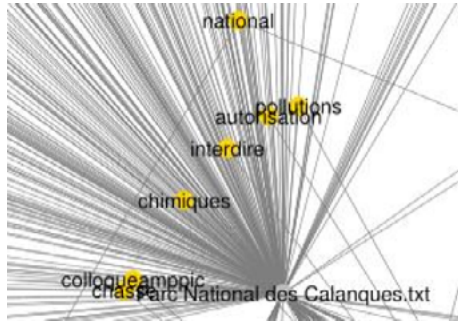
Figure 2. Visualisation des relations entre les hashtags et les mots clés du corpus

– Les relations entre deux acteurs : cette relation permet de répondre à la question « Qui parle à qui ? ».