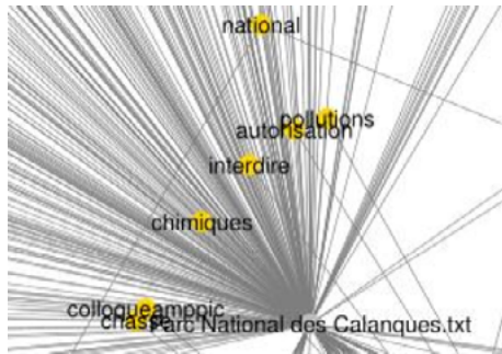
Figure 2. Visualisation des relations entre les hashtags et les mots clés du corpus

– Les relations entre deux acteurs : cette relation permet de répondre à la question « Qui parle à qui ? ».