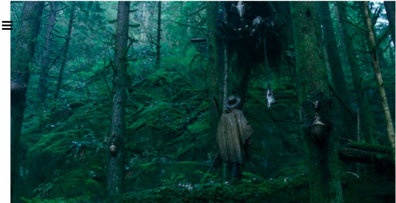
Malcolm arrive aux abords du village des singes