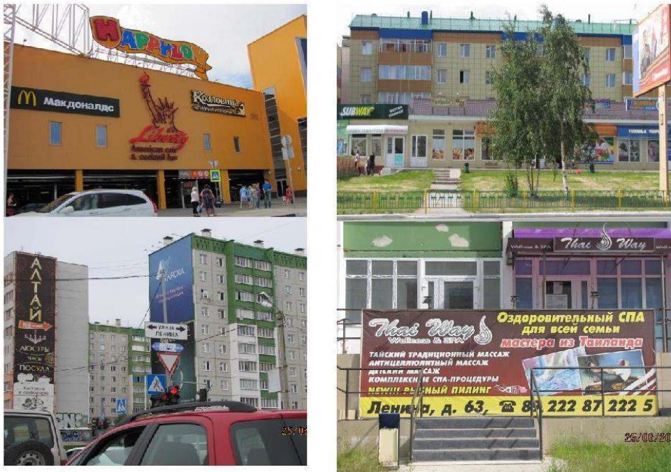
Figure 7. Emergence des paysages de consommation.

Depuis le coin haut gauche vers le coin bas droite : un centre commercial à Sourgout avec Mac Donald's ; les commerces le long de la voie piétonne, au pied des immeubles à Noïabrsk avec Subway ; un centre de massage thaï ouvert depuis peu ; des grandes affiches publicitaires à la place des peintures de Sibneft.