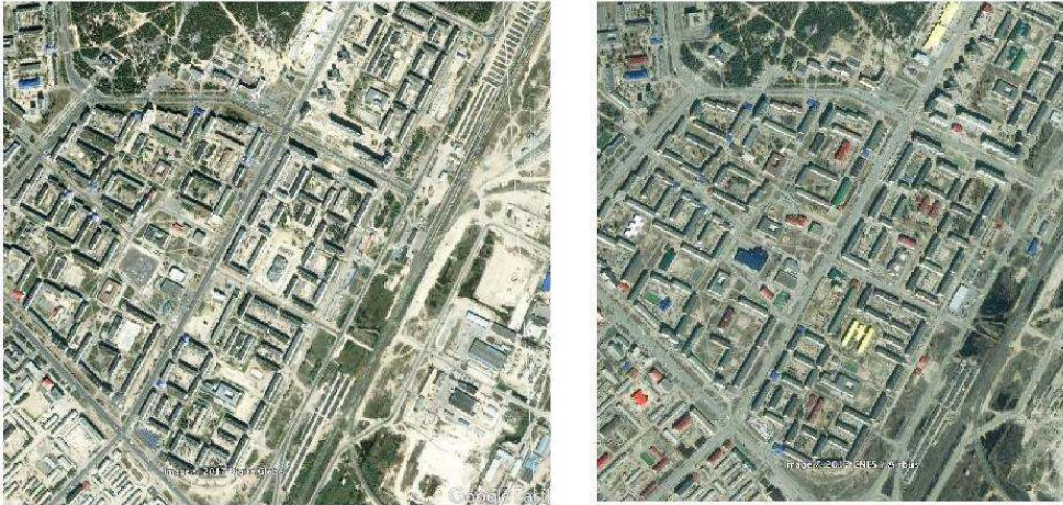
Figure 3. Urbanisme soviétique et transformations, vues du ciel.

Noïabrsk, 63°11'N 75°27'E, pétrole surtout et gaz aussi, ville depuis 1982, 109 000 hab. Zone résidentielle à l'ouest de la grande artère ; zone industrielle à l'est. On notera la présence du sol sableux partout, et des immeubles récemment coiffés de toits colorés.