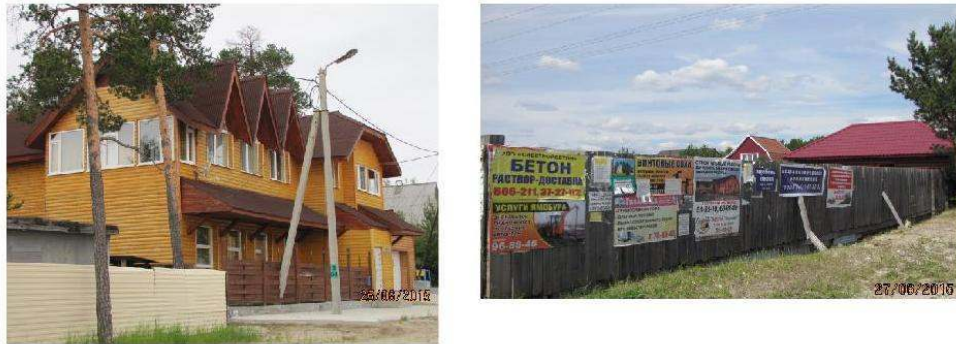
Figure 8. Emergence des espaces privés.

A gauche : Noïabrsk, la communauté fermée de Mechta à une vingtaine de kilomètre de la ville – à droite : Sourgout, quartier résidentiel fermé contigu à la ville et publicité de petites entreprises.