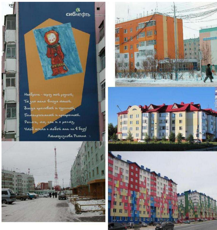
Figure 4. Arrivée de la couleur, disparition des fils électriques – vues au sol.

Noïabrsk, 63°11'N 75°27'E, pétrole et gaz, ville depuis 1982, 107 000 hab. Mouravlenko, 63°46'N 74°31'E, pétrole, ville depuis 1990, 37 000 hab. A gauche : les rares immeubles peints l'étaient par la compagnie pétrolière Sibneft, ils étaient encore visibles au début des années 2000, tout comme les innombrables fils électriques dans la ville. (2002 & 2003). A droite : la couleur est apparue à la faveur d'opérations de rénovation : en haut, à Mouravlenko en 2008, les fils électriques sont encore très présents ; au milieu : les immeubles ont été ensuite coiffés de toits colorés, et de nouvelles constructions ; en bas, à Noïabrsk en 2015 les fils électriques disparaissent.