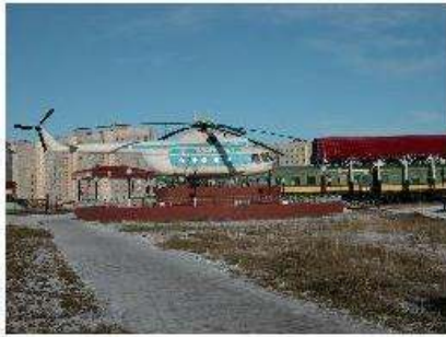
Figure 6. Emergence de nouveaux landmarks.

front pionnier, au moins dans la représentation (figure 6). Dans tous les cas, il s'agit de construire une identité locale et stimuler l'attachement des habitants.