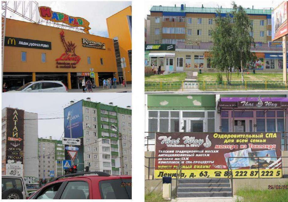
Figure 7. Emergence des paysages de consommation.

Depuis le coin haut gauche vers le coin bas droite : un centre commercial à Sourgout avec Mac Donald's ; les commerces le long de la voie piétonne, au pied des immeubles à Noïabrsk avec Subway ; un centre de massage thaï ouvert depuis peu ; des grandes affiches publicitaires à la place des peintures de Sibneft .