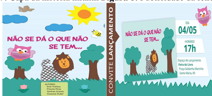
Figura 7: Capa da história infantil Figura 8: Publicidade da feira do livro

Fonte: Curso de Pedagogia (2015) Fonte: Curso de Pedagogia (2016)