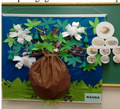
Figura 6: Ação didático-pedagógica de sistematização dos conhecimentos