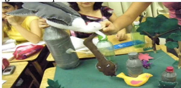
Figura 2: Maquete da cadeia alimentar da mata atlântica

Para a etapa da EMC destacaram-se as atividades transcorridas nas disciplinas de Ensino de Ciências II e Ensino de História e Geografia II , nas quais os estudantes foram desafiados a reconhecerem a biodiversidade do Rio Grande do Sul (RS), especificamente no bioma pampa e mata atlântica. Nesse sentido, houve a aproximação e qualificação dos saberes de senso comum por meio do acesso aos conhecimentos científicos. Nessa etapa, foram construídas maquetes de cadeias alimentares presentes nos biomas do pampa e da mata atlântica, tal como representa a Figura 2.