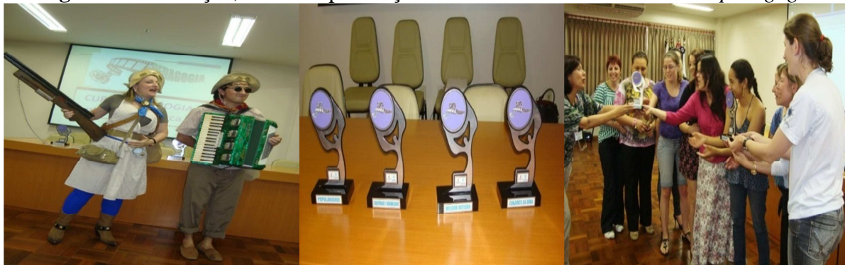
Figura 5: Encenação, troféus e premiação dos vídeos vencedores do Curtapedagogia