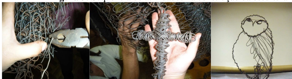
Figura 3: Sequência de atividades na construção da escultura