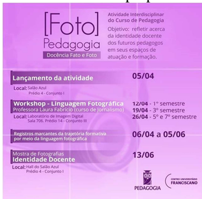
Figura 8: Banner de divulgação das atividades da proposta interdisciplinar Fotopedagogia