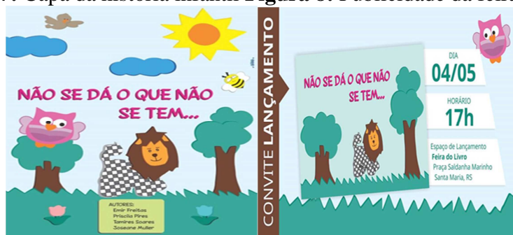
Figura 7: Capa da história infantil Figura 8: Publicidade da feira do livro