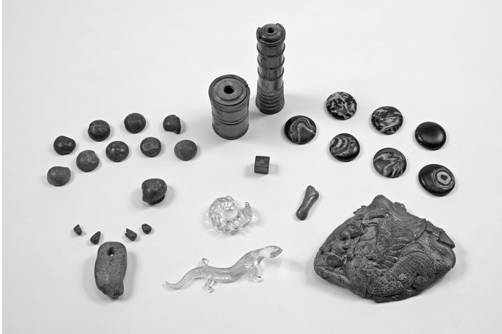
Fig. 4. Petits objets de la tombe de Cortil-Noirmont (Brabant wallon) : jetons, fibule et perles en ambre ; boîtes à fards en ivoire ; bague et lézard en cristal de roche ; jetons en verre jaspé ; coquille sculptée dans l'ambre.

moins réservé et qu'il restait en friche. C'est, du moins, ce qui ressort de deux sites ayant fait l'objet d'analyses palynologiques et pédologiques, ceux de Glimes et d'Avernas-le-Bauduin. Dans plusieurs autres cas, le monument a été érigé sur un site déjà dévolu antérieurement à une utilisation funéraire, à l'époque protohistorique ou au début de l'époque romaine. Sur l'étendue définie d'un domaine, cette première affectation a sans doute déterminé, même en dépit de liens familiaux, l'endroit sacré pour de nouvelles sépultures dont elle garantissait la pérennité. L'attraction exercée par d'anciens monuments est un phénomène bien connu dans toutes les régions et à toutes les époques. En Hesbaye, on peut évoquer le tumulus de Berlingen élevé vers la fin du 1 er s. en un lieu dont la vocation funéraire remonte au début de la Tène ; un tumulus à Niel-Saint-Trond recouvrait les traces d'un tertre palissadé tel qu'on en rencontre en Campine et dans le sud des Pays-Bas à la fin de l'âge du Bronze 32 .