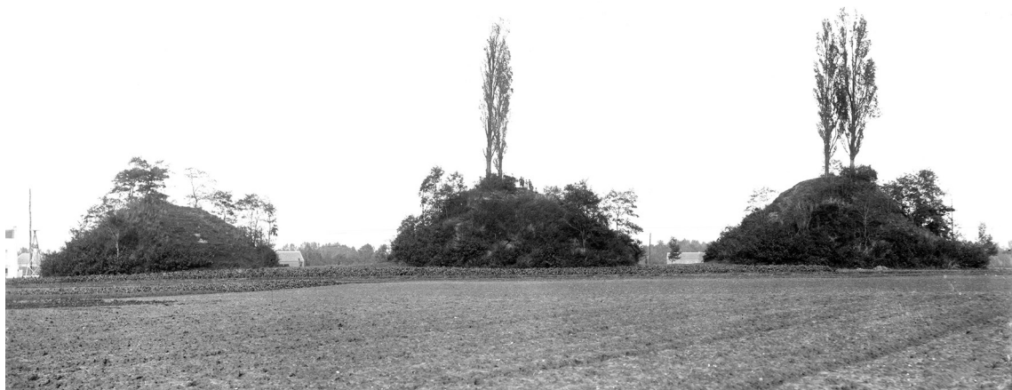
Fig. 2. Les tumulus de Tirlemont, Grimde (prov. de Brabant flamand) alignés en bordure de la chaussée antique allant à Tongres.

La nature des sols de Hesbaye, lourds et compacts, permettait des élévations très importantes. La majorité des tertres conservés, soit une soixantaine, présente actuellement des diamètres de 15 à 35 m et des hauteurs comprises entre 3 et 8 m ; les plus grands offrent encore des hauteurs de 11 à 15 m, pour des diamètres de 40 à 50 m 17 (fig. 3). Par l'effet qu'ils produisent de très loin, ils sont certainement l'une des formes les plus imposantes qui fut donnée au monumentum . L'ostentation est par ailleurs présente à toutes les étapes des funérailles, dans les cérémonies qui se sont déroulées près de la tombe et dans les caveaux qui sont de grandes dimensions, souvent soigneusement construits, en bois ou parfois en pierre dans le Brabant. Ceux-ci ont livré de grands services de table en sigillée et plus tard en verre, des ustensiles et des produits de toilette, souvent accompagnés de mobilier d'intérieur (lampes, siège, coffrets et coffres), d'accessoires personnels (armes de chasse, jetons de jeu, instruments d'écriture), ou encore d'objets symboliques et de matières magiques, liés à des croyances et des superstitions (monnaies, pièces sculptées dans l'ambre, le jais ou le cristal de roche). Quelques sépultures de la fin du II e et du III e siècles renfermaient des éléments du char ou des harnachements des chevaux qui avaient mené en grande pompe le défunt au bûcher.