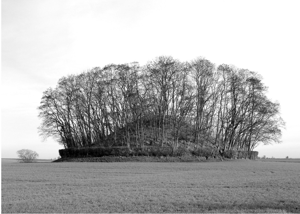
Fig. 3. Le tumulus de Grand-Rosière, Hottomont (prov. de Brabant wallon).

structures à dépôts funéraires ordinaires 19 ; elle appartient à d'autres contextes sociaux, dans cette contrée où l'on connaît aussi des habitats groupés.