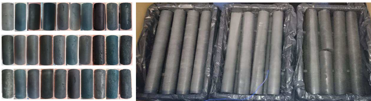
Figure 2. Gauche : Etat des éprouvettes après chaque cycle d'exposition gel-dégel (haut : eau, milieu eau gypseuse, bas : eau acide). Droite : Illustration de la conservation des carottes immergées dans les bacs placés dans les boîtes thermo-régulées lors d'un essai en condition isotherme.

Les modèles géochimiques ont été « alimentés » à partir des données expérimentales (minéralogie, porosité, diffusion, coefficient de diffusion...). Les modèles sont en accord avec les faibles évolutions constatées expérimentalement. Des profils élémentaires réalisés au MEB sur des échantillons hydratés pendant 1 an semblent globalement en accord avec les prédictions du modèle. Par ailleurs, le modèle montre un accord entre les compositions des solutions des bains de conservation acquises au bout d'un mois et au bout d'un an d'hydratation, ce qui conforte l'approche. Du point de vue des résultats des modèles géochimiques, on constate que la seule modélisation géochimique appliquée à l'évolution de la conductivité thermique ( \lambda ) prédit une