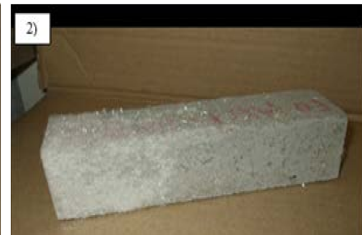
Éprouvettes conservées dans : 1) acide sulfurique, 2) sulfate d'ammonium.