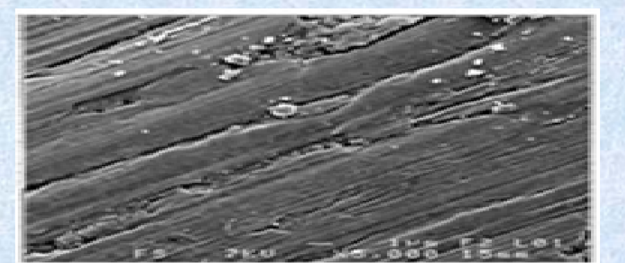
Observation au MEB de la fibre