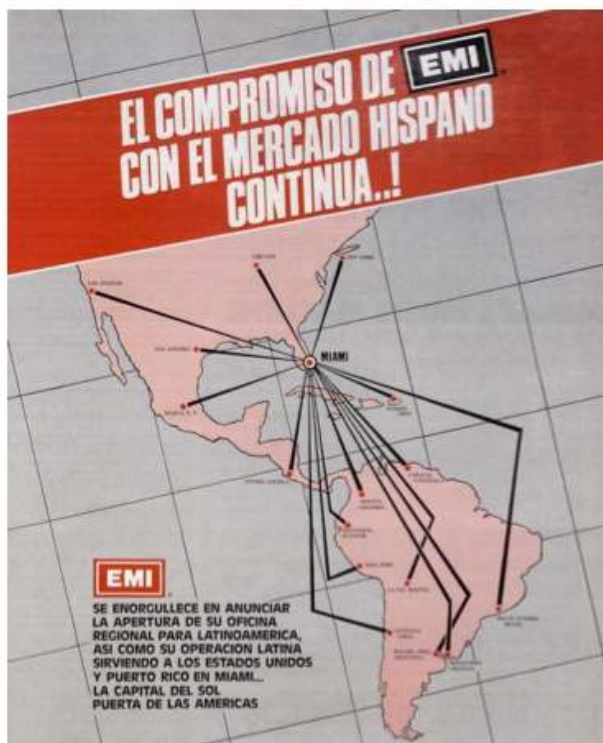
Illustration 1. Réseau de filiales