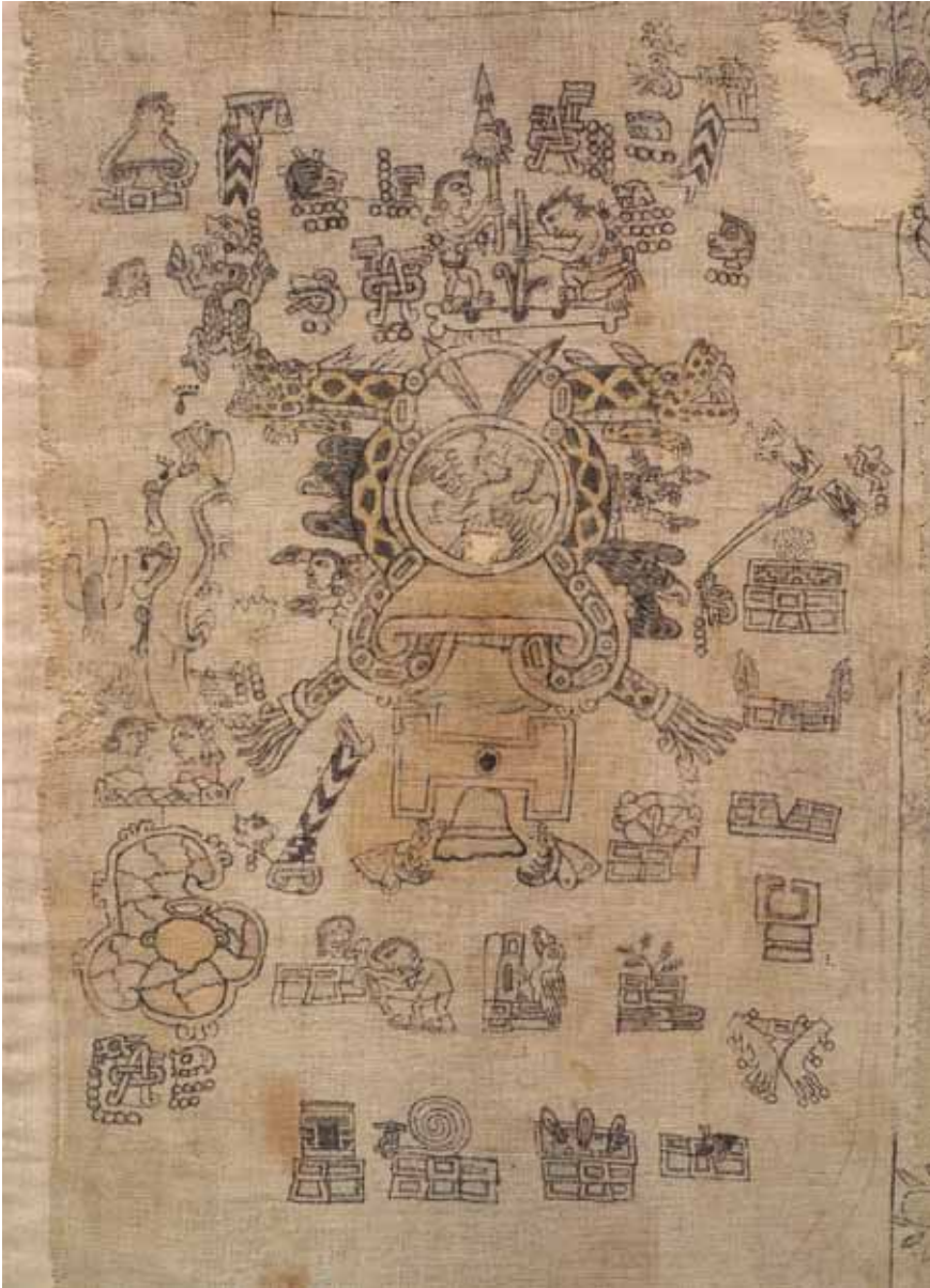
1. Lienzo de Tlapiltepec , topónimo en documento mixteco, fol. 1. Royal Ontario Museum.