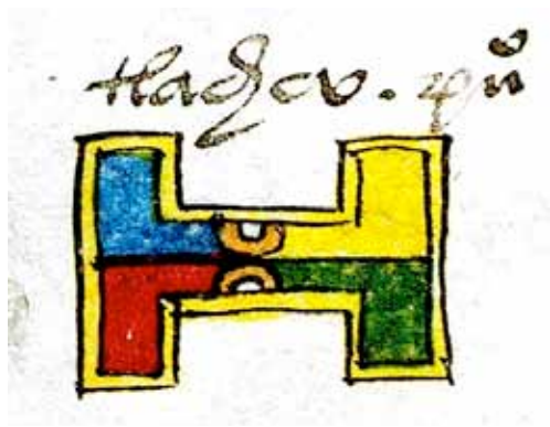
3. Códice Mendoza , topónimo de Tlachco, Bodleian Library, MS.Arch. Selden, A.1, fol. 31.

ponden a topónimos. 66 Entre los sitios identificados figuran Tlachco (Taxco) en el Códice Mendoza (31) (fig. 3), Tlachco (Querétaro), Tlachapa, Tlachualco, Zacatlachco, Tlachmalacac, Tlachyahualpa o Tlachyahualco, Tlachquiahuhco, Tlalachco, Tlachtitlan y Tlaxiaco (anexo 2). En los manuscritos mixtecos, unos sitios identificados por Caso 67 y Smith 68 serían Lugar del juego de la noche o Río del juego de pelota, lo que no implica forzosamente una transcripción lingüística. También en los manuscritos nahuas, el tlachco permite a veces la identificación de un lugar donde no aparece el término, como en el caso de Arroyo de Zapote. 69