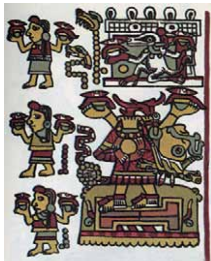
5. Códice Nuttall , fol. 3. Topónimo en documento mixteco. Escena de decapitación de II Serpiente (Xochiquetzal), tomado de The Codex Nuttall. A Picture Manuscript from Ancient Mexico , introd. Arthur G. Miller (Nueva York: Dover Publications, 1975), s.p.

Morfológicamente, de lo expuesto pueden deducirse datos nuevos. La importancia de la forma en H de las canchas basta para identificarlas. A diferencia de los arqueólogos que dedican tanta (y más) atención a las estructuras asociadas (laterales, terminales, las escaleras, entre otras), los tlacuiloques sólo representaban la cancha por la morfología de la zona de juego, como si fuera suficiente. Asimismo, los arqueólogos enfocan su atención sobre los monumentos asociados, los anillos sobre todo. Hemos subrayado el escaso número de imágenes de canchas con anillos (26 de 157), ubicadas principalmente en el altiplano. 102 Pero la mayoría de ellas carecen de anillos, como si no fueran elementos esenciales. Eso coincide con la escasez de anillos documentados, incluso en el Posclásico del altiplano.