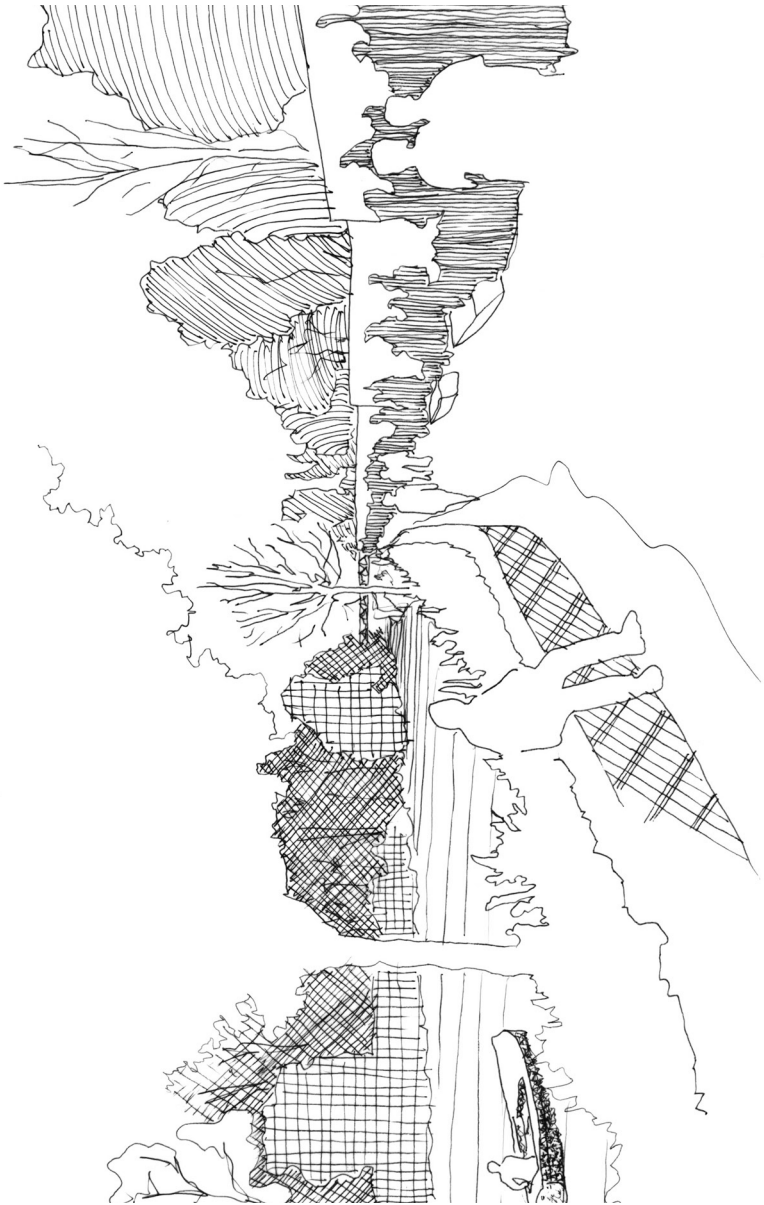
Les chemins de la rivière.