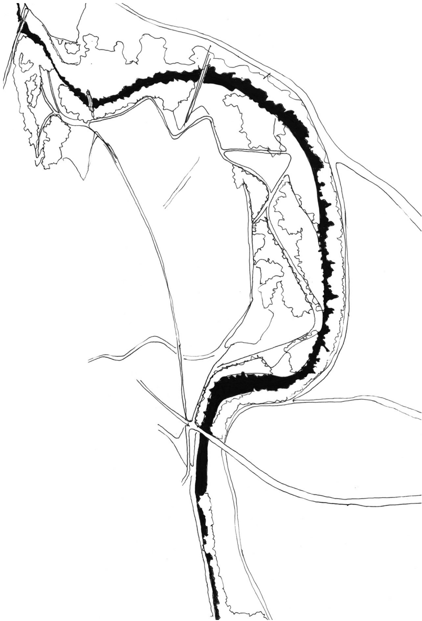
Vue aérienne des abords de la Marne