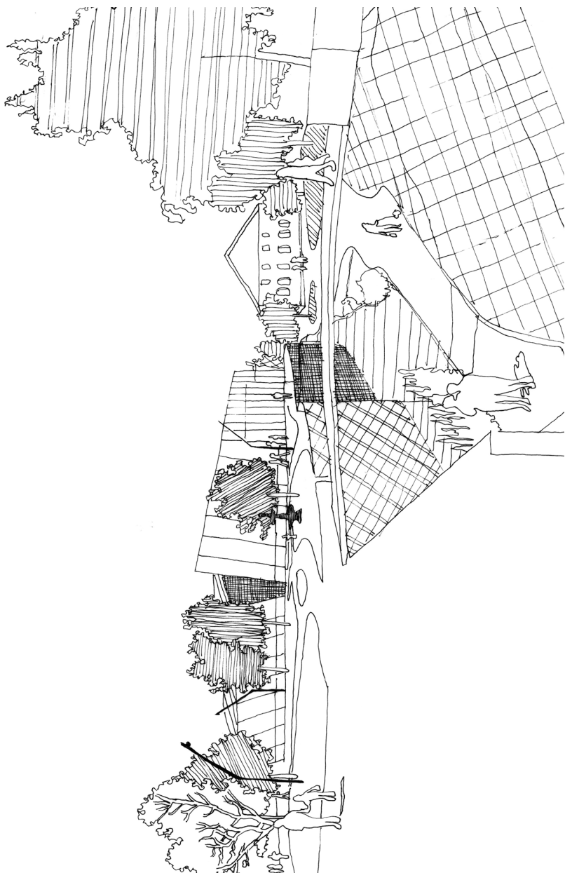
La serre culturelle.