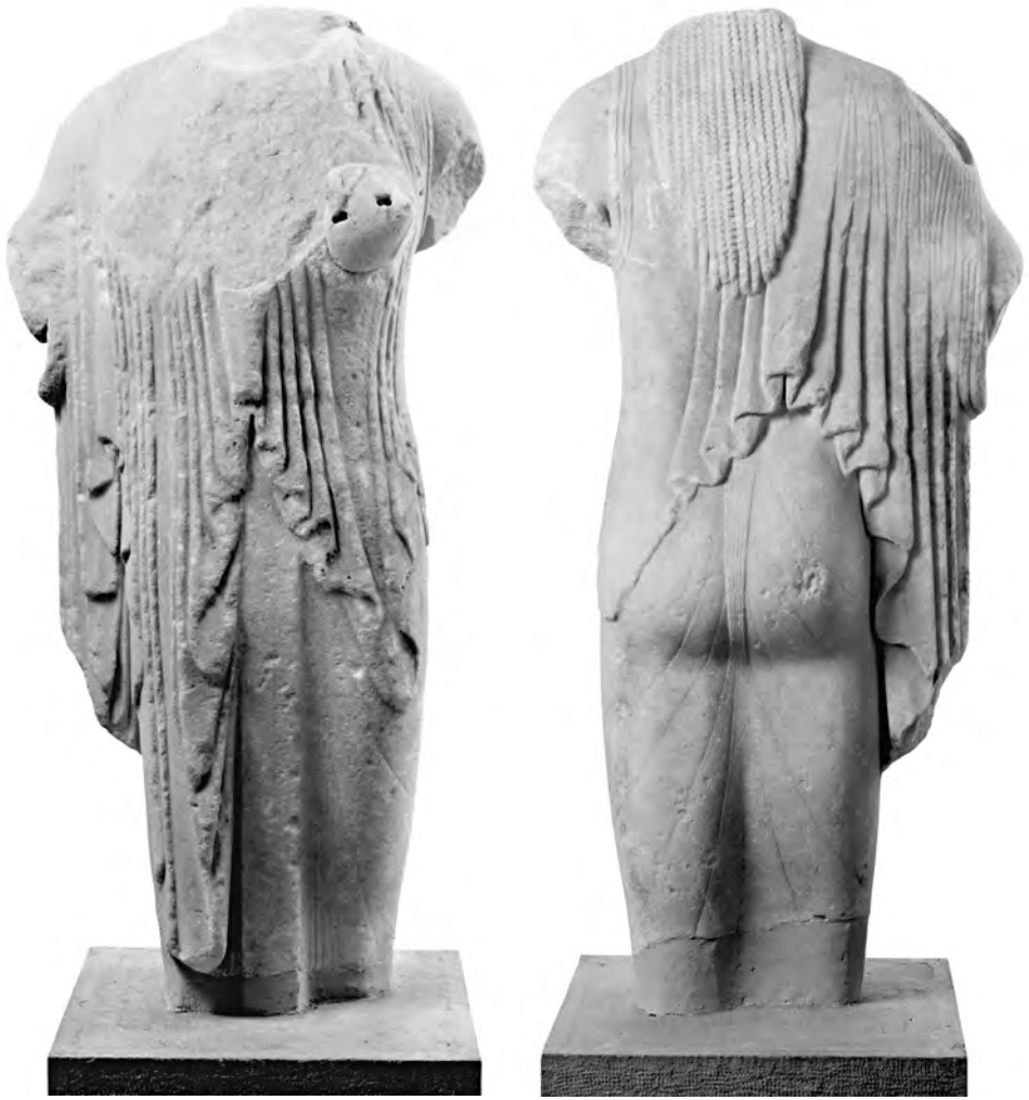
FIG. 2. La "Kore Paris" (A 4065).