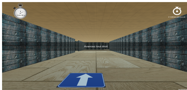
Fig. 2. : Capture-écran de l'environnement