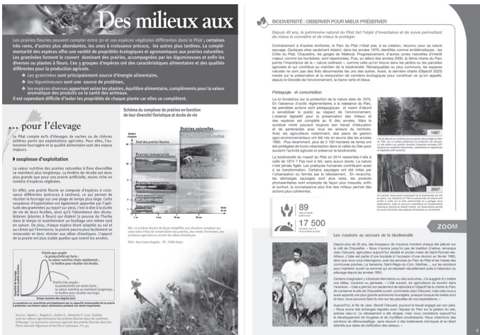
Figure 3. Représentations naturalistes et scientifiques de la nature : fleurs et prairies mises en courbes et graphiques, moutons outils de la charte du parc.

À gauche, Dossier documentaire « Prairies fleuries du Pilat : une ressource agricole à valeur écologique », p. 4, titre de la double page : « Des milieux aux multiples intérêts ».