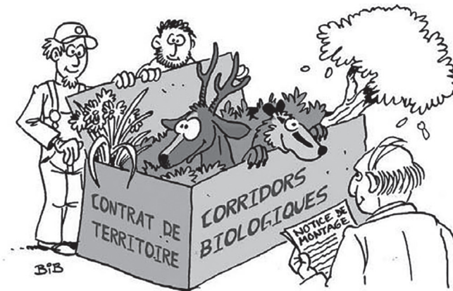
Figure 2. Illustration extraite du dossier documentaire « Corridors biologiques : des paysages pour la biodiversité » (p. 6, Parc naturel régional du Pilat)

Les dossiers lient davantage les thèmes de l'aménagement du territoire et de l'environnement, proposent une approche très gestionnaire de la nature avec, là encore, de nombreux schémas, courbes et graphiques. Un dessin du dossier documentaire « Corridors biologiques : des paysages pour la biodiversité » (2014 : 6) illustre bien une conception de la nature comme extérieure à l'homme, comme un objet soumis à son désir d'aménagement. Dans ce dessin humoristique, tout le monde sourit, humains et animaux compris, mais la position de la faune et de la flore est bien dans un carton et l'individu à droite se fie à une notice de montage 34 .