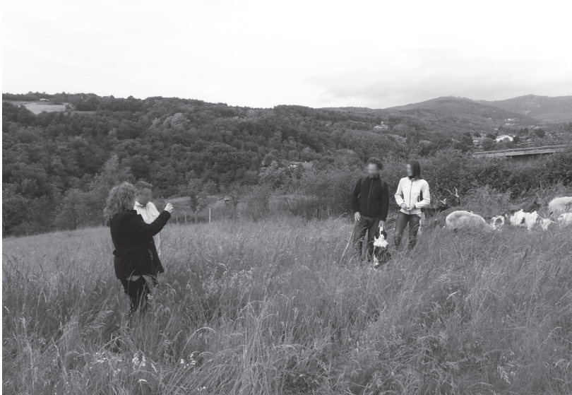
Figure 4. Visite organisée pour la presse afin de parler de Natura 2000 (21/05/2014) : journalistes, berger, chargée de mission, mais aussi « Yucca », la chienne border collie, les moutons et les chèvres des Roves

médiatiques », utiliser les détails morbides pour scandaliser; faire parler les animaux (anthropomorphisme), professionnaliser la communication des militants.