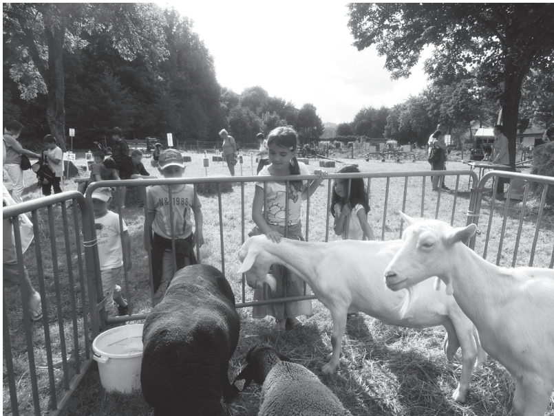
Figure 5. Fête des 40 ans du Parc du Pilat, 21 septembre 2014 : espace vert, enfants et animaux « à caresser »

« C'est la fête. Toutes les places et rues sont décorées, investies. Une scène ouverte assure des concerts. Aux abords du village, on trouve des ânes et des carrioles à bœufs. On nous distribue des bracelets, des quizz, des autocollants, des flyers de tous les côtés au gré des stands occupés par des fédérations, des associations, des collectivités. À la périphérie du village, dans un espace vert, autre ambiance. Les stands informatifs laissent la place à des mini-enclos, sans panneaux, sans dépliants, sans associations attachées. C'est l'espace des animaux agricoles. Des enfants entourent les enclos et essayent de caresser chèvres ou moutons. La seule médiation qui subsiste alors est le contact proposé, directement, avec l'animal » (extrait du carnet de terrain de l'auteure).