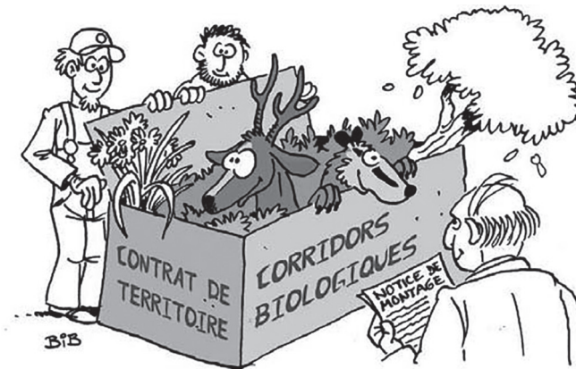
Figure 2. Illustration extraite du dossier documentaire « Corridors biologiques : des paysages pour la biodiversité » (p. 6, Parc naturel régional du Pilat)

Les dossiers lient davantage les thèmes de l'aménagement du territoire et de l'environnement, proposent une approche très gestionnaire de la nature avec, là encore, de nombreux schémas, courbes et graphiques. Un dessin du dossier documentaire « Corridors biologiques : des paysages pour la biodiversité » (2014 : 6) illustre bien une conception de la nature comme extérieure à l'homme, comme un objet soumis à son désir d'aménagement. Dans ce dessin humoristique, tout le monde sourit, humains et animaux compris, mais la position de la faune et de la flore est bien dans un carton et l'individu à droite se fie à une notice de montage 34 .