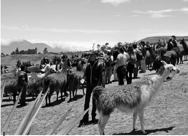
Figura 2 – Participantes del 3 EIAA en el sitio arqueológico de Cochasqui al norte de Quito

de cinco exposiciones: «Paisajes ecuatorianos» con fotografías de Jorge Anhalzer en la FLACSO, «Sonrisas amazónicas» con fotografías de Nigel Smith en la FLACSO, «La civilización Mayo Chinchipe-Marañón» en la Alianza francesa, «Primeras sociedades de la alta Amazonía» en el Museo Nacional del Banco Central, y por fin la inauguración del nuevo museo amazónico de Abya-Yala. Se visitó también el museo arqueológico de la Casa del Alabado en Quito. A mediados de semana, mientras la mayoría de los congresistas descubrían el