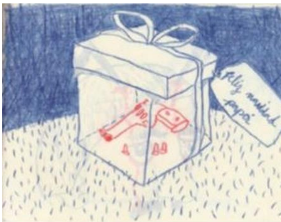
Fig. 4 «feliz navidad, papá»

14 El acercamiento a la historia reciente se lleva a cabo oblicuamente en esta serie de Tomás Alzogaray Vanella, a través del trabajo con géneros menores con respecto a las artes visuales como el dibujo infantil, o a la literatura, como el cuento folclórico tradicional, o aun a la fotografía, a través de la foto carnet. A través de ellos se potencia la violencia, gracias al contraste entre los mismos rasgos de escritura infantil,