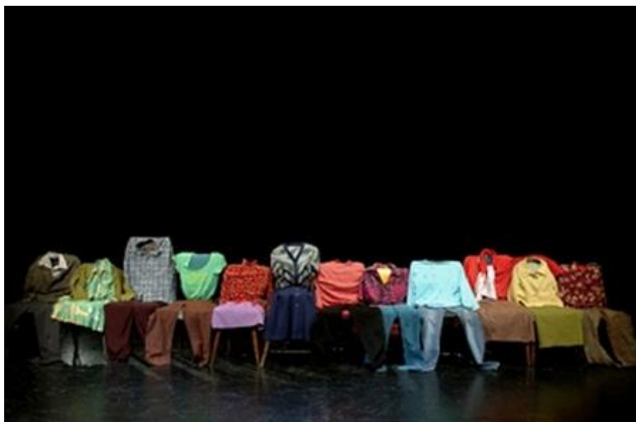
Fig. 9 Fotograma representación de Mi vida después en Mi vida después y otros textos . Op. cit., p. 7

38 A partir de este núcleo que parte de la experiencia generacional, las producciones teatrales, performáticas o cinematográficas de Lola Arias se abren a una dimensión transnacional inmediata, al incorporar la experiencia de la generación de los hijos de la dictadura chilena en El año en que nació (2011) para extenderse a un espacio transnacional aún más abarcador que integra a migrantes, como en la experiencia de Hoteles/Mucamas (2010-2011), a veteranos ingleses y argentinos de la guerra de Malvinas ( Campo minado/Minefield 2013-2017; Teatro de guerra 2018), a niños ( Airport Kids 2008), a mujeres cuya historia ha cruzado la «idea socialista» ( Atlas del comunismo 2016) 45 , a manifestantes de diversas épocas, ciudades y países ( Audición para una manifestación : Atenas 1973, Berlín y Praga 1989, Buenos Aires 2001).