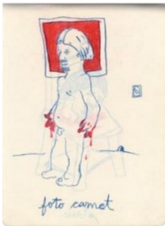
Fig. 3 «foto carnet»