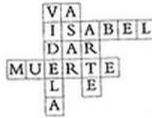
Fig. 7, Laura Alcoba, La casa de los conejos , p. 118.

Asesino. Casualidad. Literatura, música.