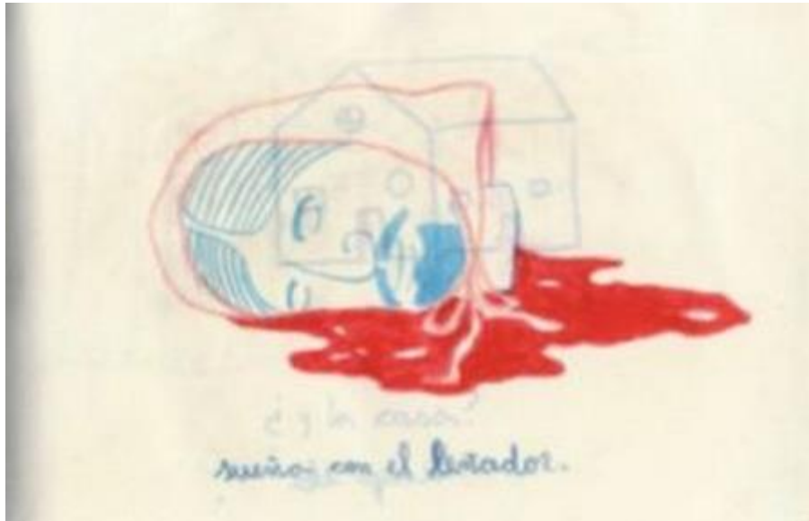
Fig. 2 «sueño con el leñador»

12 Otro género se invita de este modo a la composición: el reverso inquietante de los cuentos para niños, de sus brujas y sus ogros, sus lobos y sus cazadores (fig. 2). Hablan de mundo excepcional, o de un estado de excepción en el que las leyes que rigen el mundo –físicas, en los cuentos; institucionales, en la Argentina de la dictadura– han quedado abolidas.