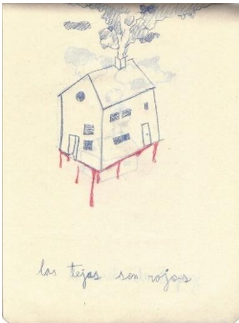
Fig. 1 «las tejas son rojas» 19

19 La serie de dibujos que compone el cuaderno «Un niño de 30 años» vuelve entonces, como su nombre lo indica, a tiempos ya lejanos que no terminan sin embargo de poder dejarse atrás. Florencia Basso estudia los cinco cuadernos dedicados por Tomás Alzogaray Vanella a la experiencia de la dictadura y el exilio de su familia en México y analiza la construcción de esta figura del artista adulto/niño: