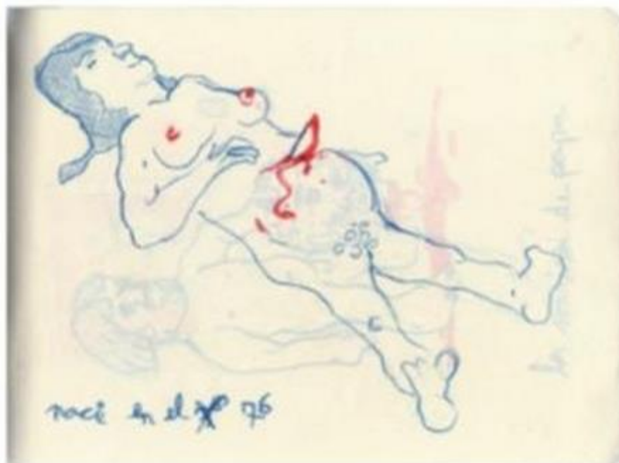
Fig. 6 «naci en el 76»