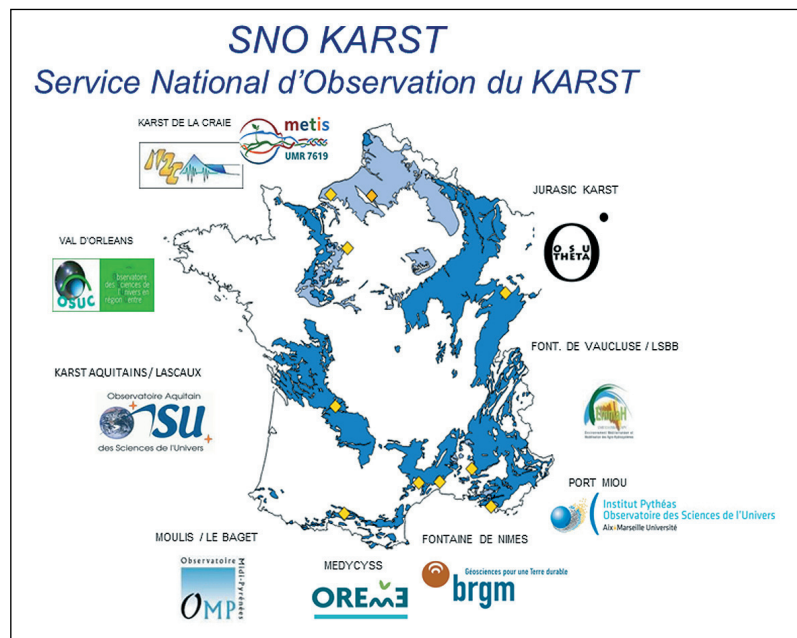
Figure 1. Localisation des différents sites d'observations du SNO KARST et organismes impliqués.

L'un des défis majeurs de la recherche sur le karst est donc de tendre vers une nouvelle approche « synthétique » à l'échelle des grandes typologies karstiques, depuis la caractérisation de leur structure et de leur fonctionnement jusqu'à la modélisation hydrodynamique et hydrogéochimique des transferts au sein des différents compartiments. Ceci nécessite de fédérer les forces d'observation et de recherche actuelles pour comparer et unifier les approches au niveau national, puis international, tant sur les outils et les méthodes que sur les concepts. Ce constat a motivé la mise en place d'un réseau d'observation des hydrosystèmes karstiques, le SNO KARST.