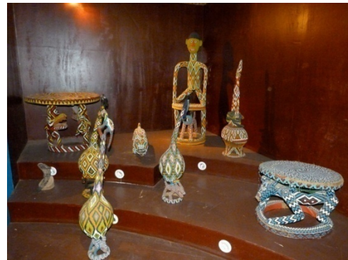
Photo 8 Présentation d'objets en perles brodés. Trésor royal, Musée de Bamendjou