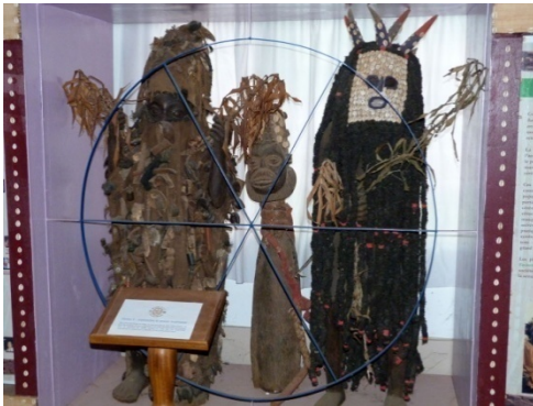
Photo 5 - Représentation société Kun' gang - Musée de Bamendjou

patrimoine industriel a tendance à le réenchanter, en gommant le plus souvent les indices relatifs aux conditions de travail, au contexte socio-politique, nous montrons pour notre part que l'expographie du patrimoine des chefferies de l'ouest du Cameroun pourrait à contrario avoir pour effet de le désacraliser. Quelles sont alors les interprétations que se font les visiteurs de telles mise en scène ? Ne risquent-elles d'être, pour partie, opposées aux souhaits des concepteurs ?