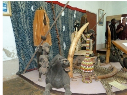
Photo 6 - Représentation du trône, Musée de Bamendjou