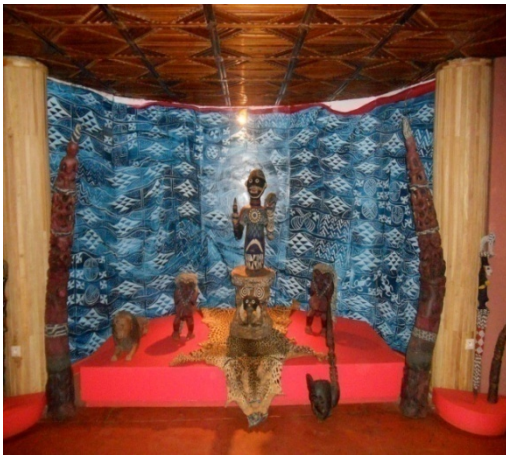
Photo 7 - Représentation du trône, Musée de Dschang