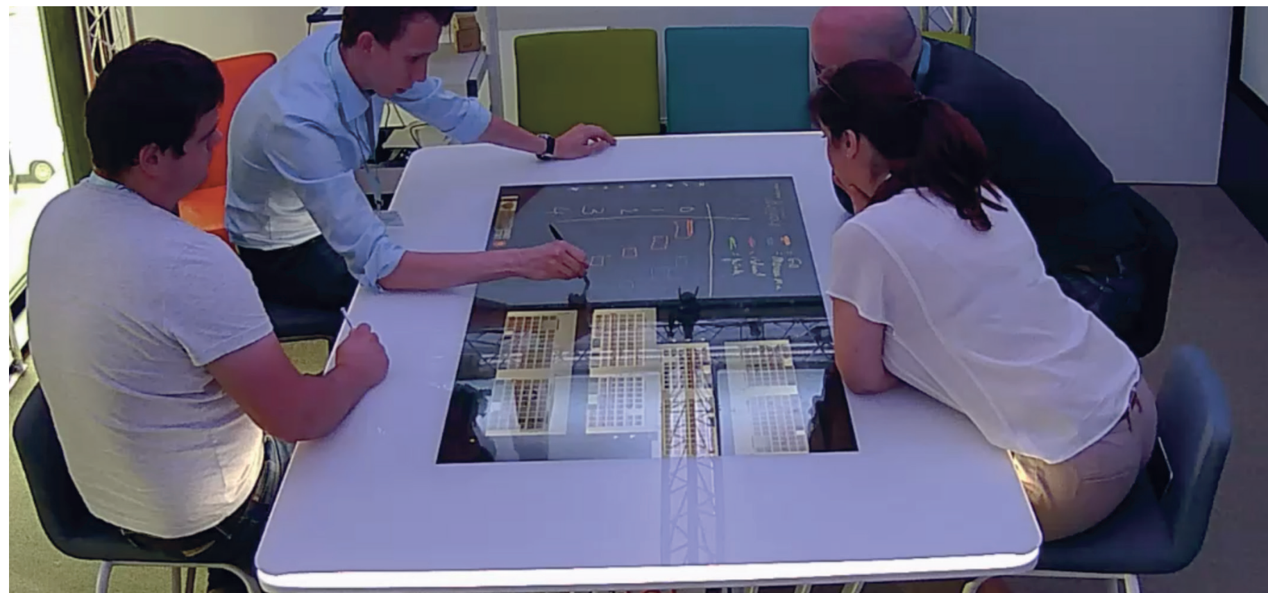
Figure 1 - Session de collaboration autour d'une table tactile avec le logiciel Shariing dans le cadre d'expérimentation 4D Collab

Ces nouvelles interactions devront être définies et intégrées à une plateforme composée de surfaces tactiles et du logiciel collaboratif synchrone «Shariing» d'Immersion (Fig.1) [2].