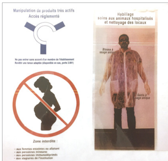
Photo 7. Signalétique à l'entrée du chenil de chimiothérapie.

CMR. Le stockage de ce container se faisait dans une annexe de la salle de consultation avant évacuation et élimination via une filière spécifique.