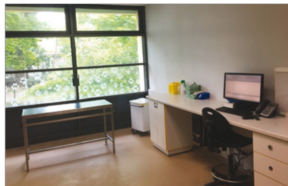
Photo 2. Salle de consultation et de chimiothérapie en 2014.

À l'issue du traitement, l'ensemble du matériel utilisé était jeté dans un container spécifique et identifié comme contenant des déchets