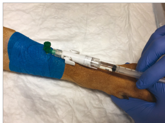
Photo 5. Injection de chimiothérapie chez un chien par un système clos d'injection Tevadaptor®.