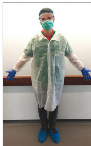
Photo 3. Mesures de protection appliquées par le personnel réalisant la chimiothérapie.