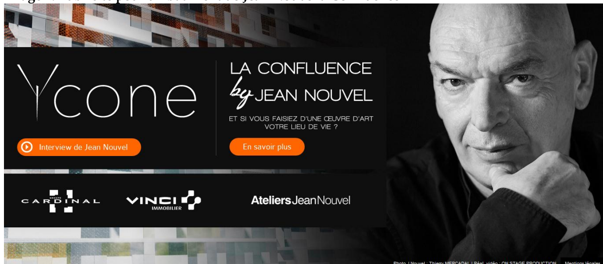
Image 2. Publicité pour un bâtiment de Jean Nouvel à Confluence

Source : Groupe Cardianl, Vinci Immobilier, Ateliers Jean Nouvel