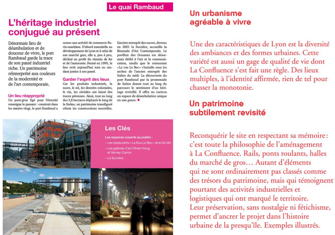
Image 3. Extraits de plaquettes de l'aménageur du quartier