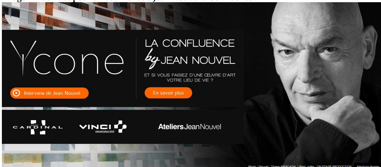
Image 2. Publicité pour un bâtiment de Jean Nouvel à Confluence

Source : Groupe Cardianl, Vinci Immobilier, Ateliers Jean Nouvel