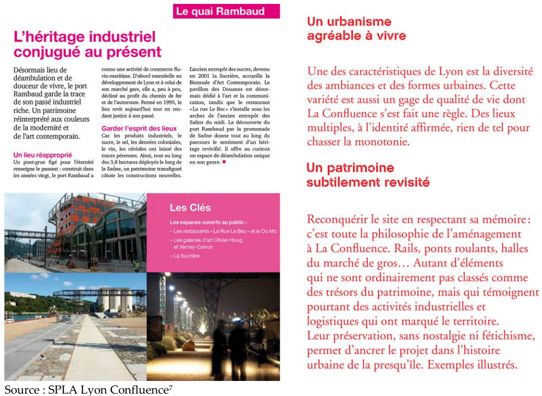
Image 3. Extraits de plaquettes de l'aménageur du quartier