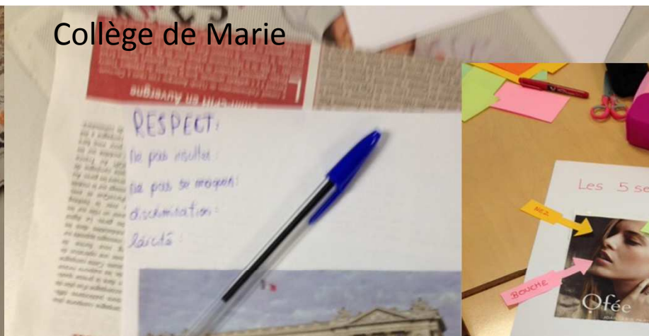
Collège de Marie