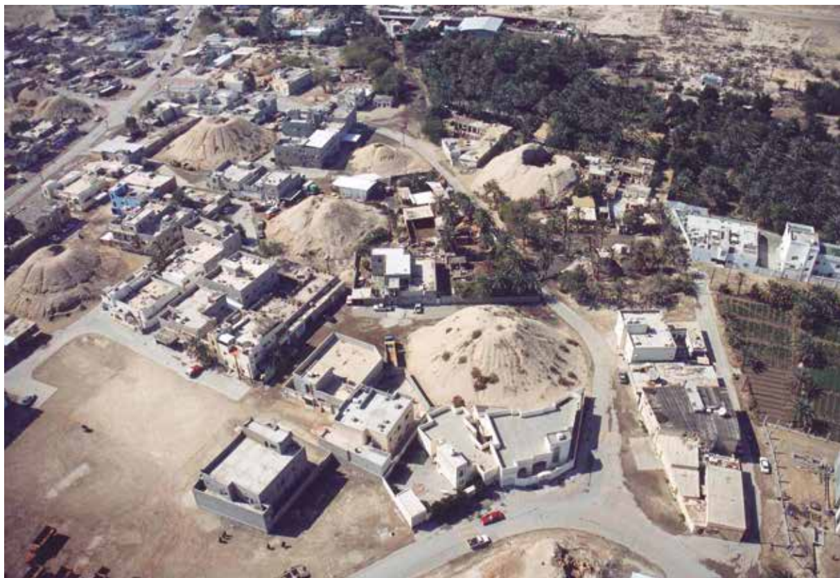
Figura 6. El sector de los “túmulos reales”, en el norte de la necrópolis de ‘Alí.

los mucho más elaborados que comprenden cámaras colectivas, a veces de dos niveles: se trata de monumentos infinitamente más impresionantes que requirieron una participación colectiva más considerable y a los que en general se considera –sin sorpresa alguna– como destinados a recibir a los gobernantes o a los miembros de la élite de una población, cuyo estrato social inferior parece haber sido inhumado en el primer tipo de túmulos. En un sector en especial de la necrópolis de ‘Alí, el agrupamiento de una veintena de túmulos de ese género, que pueden alcanzar hasta 10 metros de altura (por 25 metros de diámetro en la base) fue calificado incluso –en un consenso cuasi general– como necrópolis “real” (Bibby, 1970: 356-358; Breuil, 1998: 264 y ss.; Højlund, 2007: 134-135; Laursen, 2008: 160-165) (figura 6).