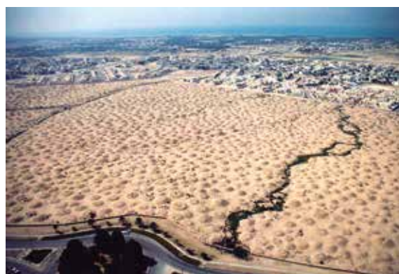
Figura 3. La necrópolis de Karzakkan.

Según los datos de Højlund et al. , 2008: 145, fig. 2.