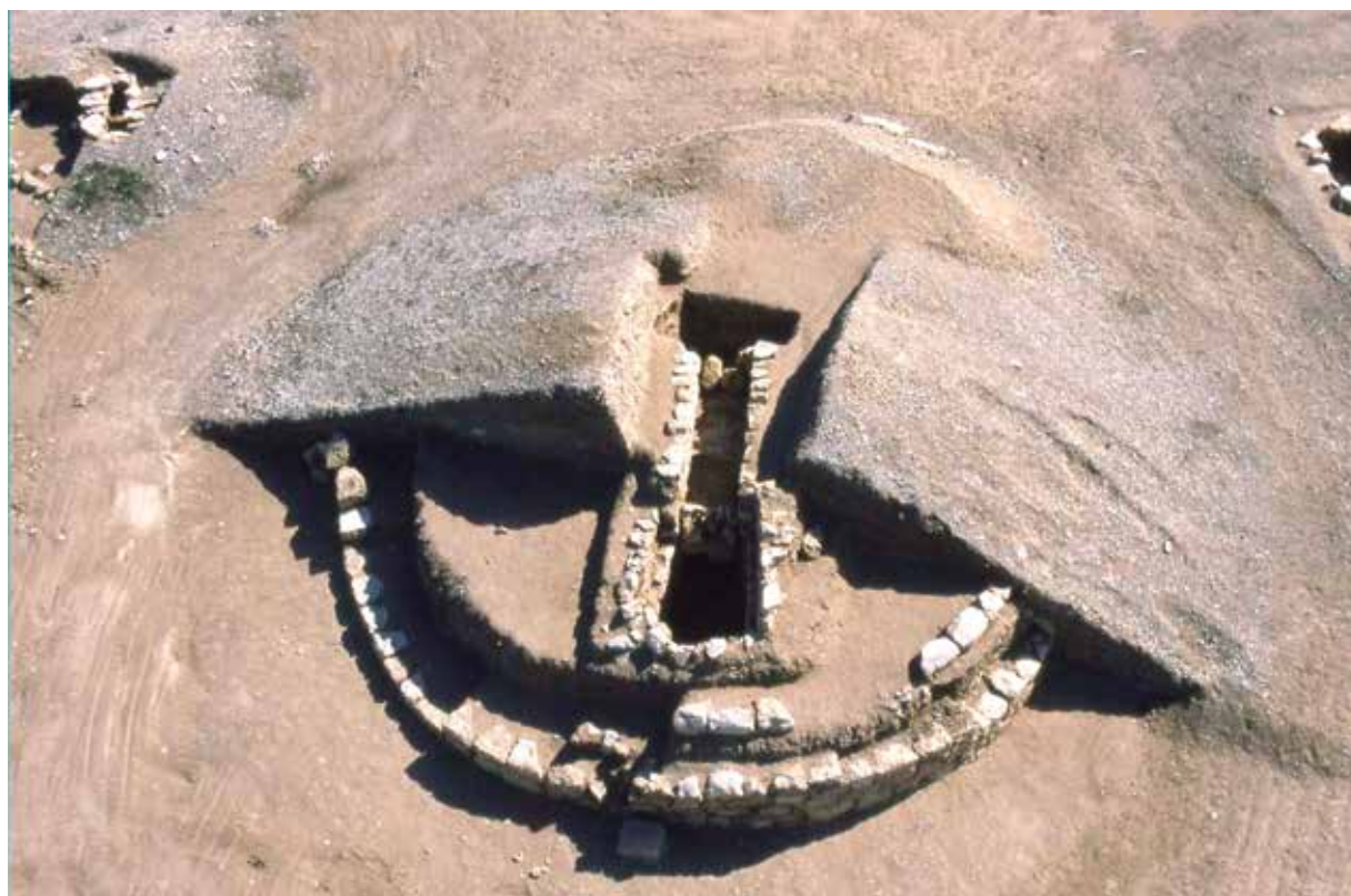
Figura 8. Túmulo “elitista” de la necrópolis de Janabiyah.

Al igual que los túmulos “básicos”, estos grandes monumentos presentaban un aspecto muy diferente en la antigüedad. Es conveniente reconstruir figuradamente –como en el