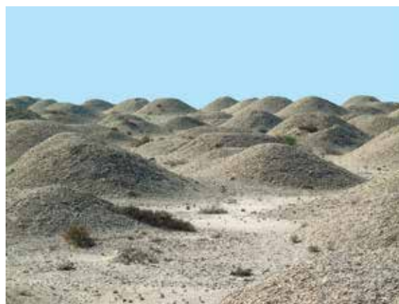
Figura 4. Túmulos de tipo "reciente" de la necrópolis de Buri.