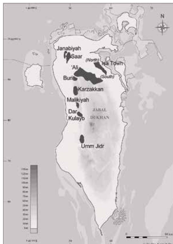
Figura 2. Localización de las necrópolis de túmulos, en la isla principal de Bahrein.

Después de recordar el contexto particular en que se llevan a cabo las investigaciones actuales sobre los túmulos de Bahrein (primera parte), se presenta su tipología y arquitectura, así como el depósito funerario asociado a ellos y las indicaciones cronológicas que proporciona este último (segunda parte); finalmente, se examina el grado en que el estudio de las necrópolis de Dilmún permite discernir la compleja organización social que acompañó y estructuró esa cultura a finales del tercer milenio y en el primer cuarto del segundo milenio antes de nuestra era (tercera parte).