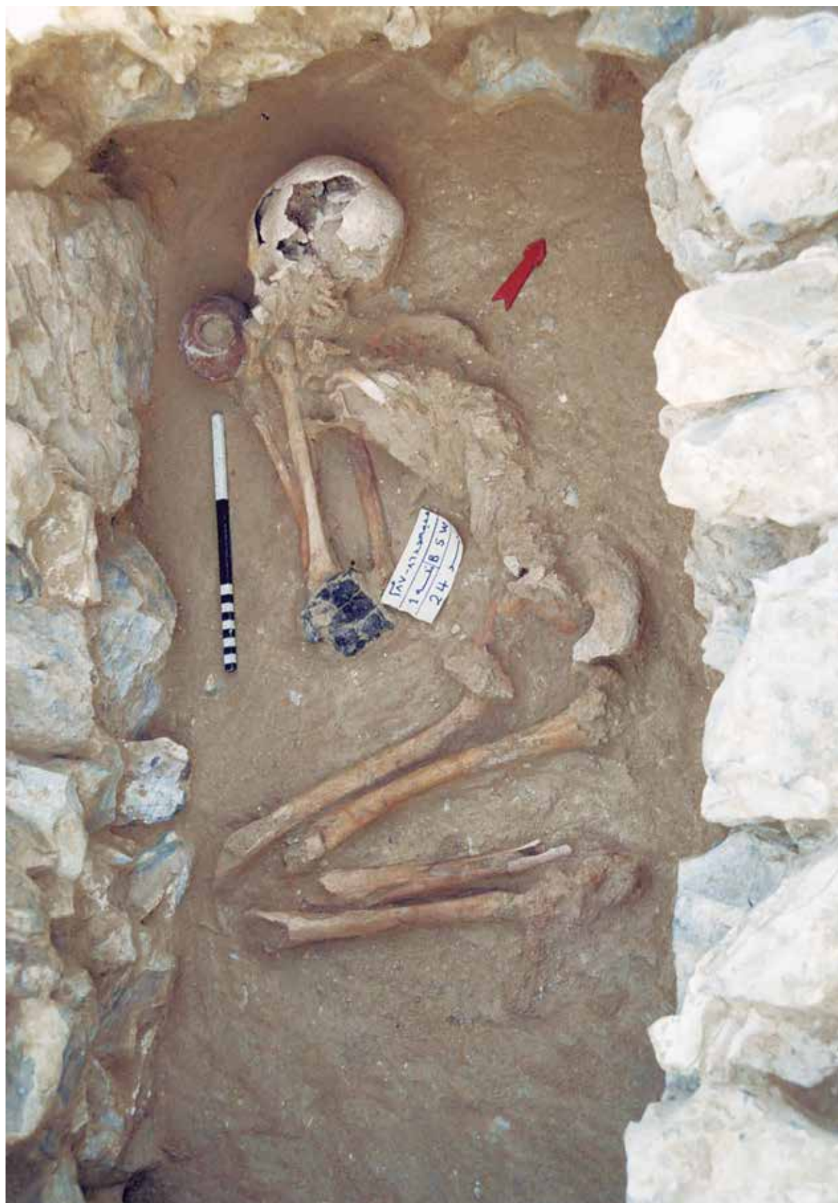
Figura 7. Una cámara funeraria y su inhumación.