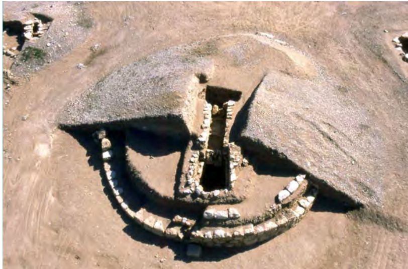
Figura 8. Túmulo “elitista” de la necrópolis de Janabiyah.

Estas tumbas "reales" o "elitistas" tienen accesos especiales, la mayoría de las veces bajo la forma de un pozo vertical de forma cuadrangular, de dos a cuatro metros de lado, con una profundidad que, dependiendo de la altura del monumento, puede superar los ocho o diez metros. La abertura está situada en la cima del túmulo y desemboca en la entrada de cada cámara funeraria ( figura 8 ).