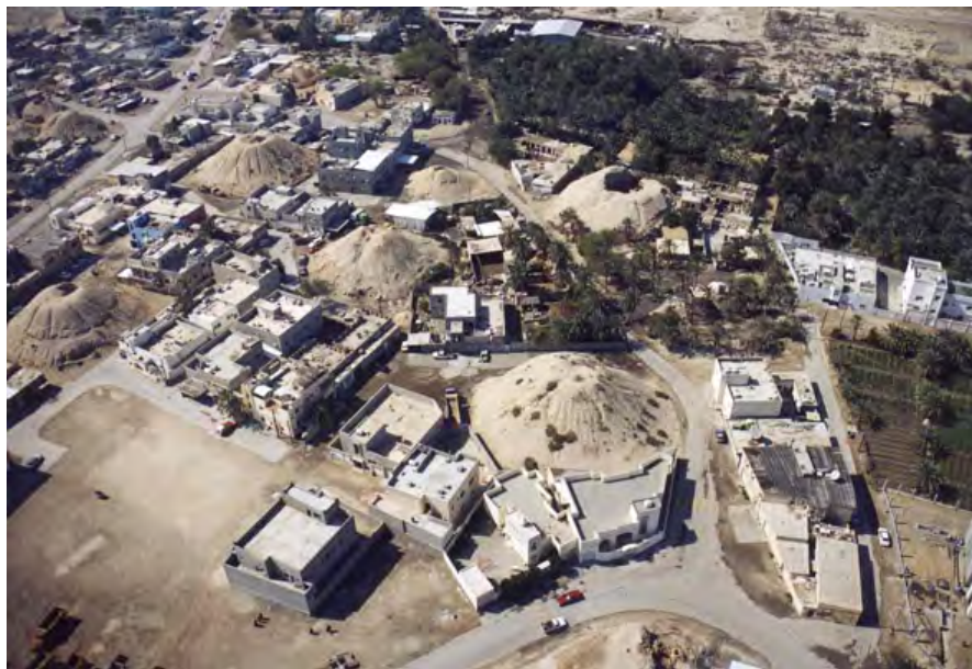
Figura 6. El sector de los “túmulos reales”, en el norte de la necrópolis de ‘Alí.

ocasiones en una misma necrópolis- uno o varios túmulos mucho más elaborados que comprenden cámaras colectivas, a veces a dos niveles: se trata de monumentos infinitamente más impresionantes que requirieron una participación colectiva más considerable y a los que en general se considera —sin sorpresa alguna— como destinados a recibir a los gobernantes o a los miembros de la élite de una población cuyo estrato social inferior parece haber sido inhumado en el primer tipo de túmulos. En un sector en especial de la necrópolis de ‘Alí, el agrupamiento de una veintena de túmulos de ese género, que pueden alcanzar hasta 10 metros de altura (por 25 metros de diámetro en la base) fue calificado incluso —en un consenso cuasi general— como necrópolis “real” (Bibby, 1970: 356-358; Breuil, 1998: 264 y ss. ; Højlund, 2007: 134-135; Laursen, 2008: 160-165) (figura 6).