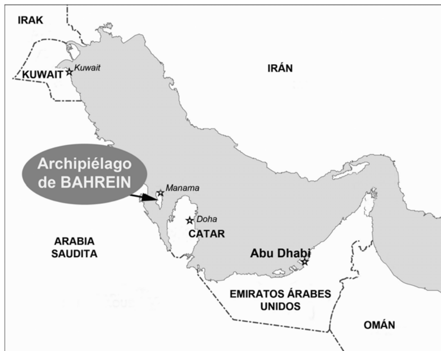
Figura 1. El archipiélago de Bahrein, en el Golfo árabe-pérsico.

Si acaso hay algún lugar en el mundo donde la noción de paisaje funerario reviste un significado muy particular, sin duda alguna, es la isla principal del archipiélago de Bahrein, en el Golfo Pérsico o golfo árabe-pérsico ( figura 1 ), la cual comprende aun hoy la mayor concentración del mundo de sepulturas bajo túmulos, testimonios de la civilización de Dilmún, que se desarrolló en la antigüedad en esa región del Oriente Próximo, de finales del tercer milenio al año 1750 a. C., aproximadamente. Ese conjunto funerario único de la Edad del Bronce estaba disperso en una decena de necrópolis distintas: Isa Town North, Isa Town South, Saar, Janabiyah, ‘Alí, Buri, Karzakkan, Malikiyah, Dar Kulayb y Umm Jidr. Originalmente, se extendía sobre una superficie de aproximadamente 30 kilómetros cuadrados, lo que lo hacía, al mismo tiempo, impresionante y omnipresente ( figura 2 ).