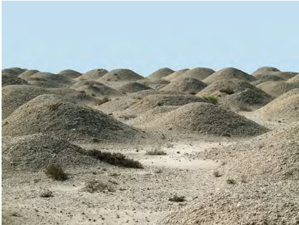
Figura 4. Túmulos de tipo “reciente” de la necrópolis de ‘Alí.

Después de recordar el contexto particular en que se llevan a cabo las investigaciones actuales sobre los túmulos de Bahrein (primera parte), se presenta su tipología y arquitectura, así como el depósito funerario asociado a ellos y las indicaciones