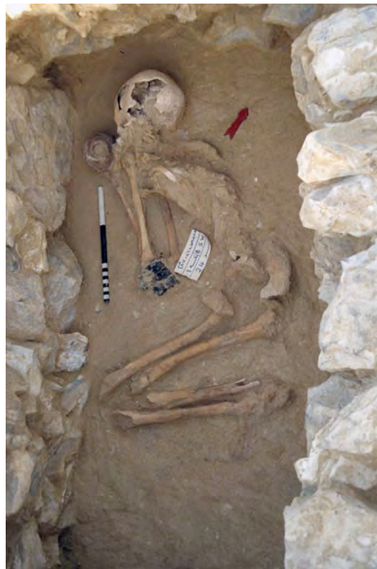
Figura 7. Una cámara funeraria y su inhumación.

Mediante la excavación concienzuda de los túmulos se logró demostrar que las tumbas fueron edificadas en dos etapas: la primera fase de construcción, posiblemente bajo el mando en vida del propio futuro ocupante, consistía en edificar la cámara funeraria hasta la cúspide, así como el muro circular del monumento. El espacio entre el muro del recinto (de un diámetro medio que variaba entre seis y diez metros) y la cámara se rellenaba con tierra y grava. Así, la tumba podía permanecer abierta durante todos los años que precedían al deceso de su futuro ocupante. Cuando éste fallecía, se depositaba su cuerpo en decúbito lateral, con la cabeza apuntando al norte, las piernas y los brazos flexionados y las manos vueltas hacia el rostro (figura 5, dibujos D-E y figura 7).