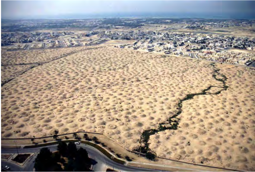
Figura 3. La necrópolis de Madinat Hamad.