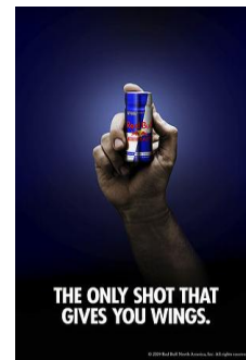
Fig. 24 : give sb wings

Pour ce qui est de la relation entre l'EI flog a dead horse , signifiant « ressasser un sujet, se fatiguer en vain, gaspiller son temps pour rien » de la publicité Pedigree (fig. 23) et l'image représentant une boîte de pâtée pour chiens, elle n'existe que dans la mesure où cette boîte peut