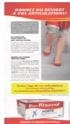
Fig. 14 : donner du ressort à qqch

den properties d'une métaphore s obligatoirement actualisées par l'