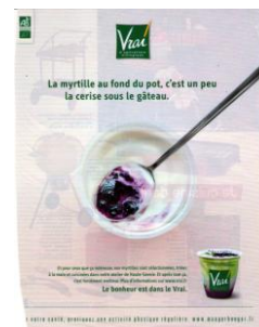
Fig. 20 : la cerise sur le gâteau

suivantes. L'interprétation de la photo de Michel Drucker en lien avec le slogan qui comprend l'EI imagée « s'envoyer des pics » (fig. 19) ne revêt en effet de sens uniquement si l'on sait qu'au sein de ses émissions, ses invités, tout