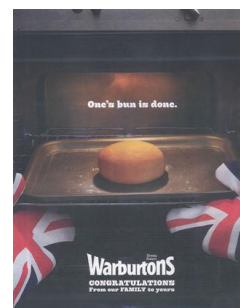
Fig. 12 : have a bun in the oven

Contrairement aux print adverts du point 3.1., il est beaucoup moins certains que l'image matérielle renforce la métaphore verbale lorsque la partie picturale ne représente que partiellement l'image linguistique. Toutefois, des expériences à l'instar de celles menées par McQuarrie et Mick [1999] serait nécessaires afin de pouvoir constater avec certitude que la valeur argumentative de la métaphore – et par conséquent de la