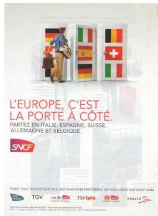
Fig. 1 : la porte à côté

Les métaphores verbales de cette catégorie possèdent un sens métaphorique (renvoyant à une réalité abstraite) et un sens littéral (renvoyant à une réalité concrète), ce dernier pouvant être représenté via une image matérielle.