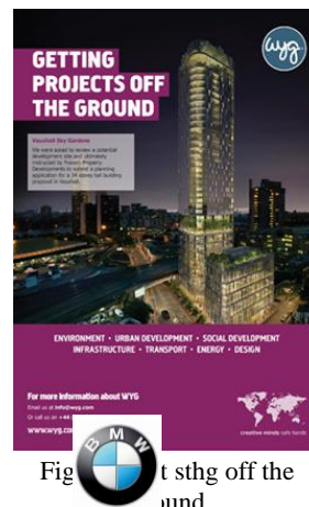
Fig. 18 : get sthg off the ground

relation dialectique entre image matérielle et linguistique get sthg off the ground . Le gratte-ciel de la photo n'a pas de sens sans le slogan, ce dernier étant concrétisé par la photo (fig. 18).