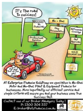
Fig. 5 : the road to success

De la même manière, les métaphores verbales, transparentes pour ce qui est de la relation entre DS et DC, transportées par les EI the road to sthg (fig. 5) et be in sb's hands (fig. 6), peuvent être illustrées et ainsi renforcées par les images matérielles respectives qui illustrent le sens littéral des EI :