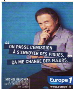
Fig. 19 : envoyer des pics

Le rapport entre l'image matérielle et l'image linguistique véhiculée par l'EI métaphorique peut aussi être totalement opaque comme dans les deux publicités françaises