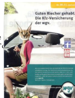
Fig. 16 : einen guten Riecher haben