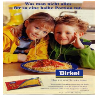
Fig. 22 : eine halbe Portion

lingre et/ou à ne pas prendre au sérieux, l'image représente uniquement deux enfants qui se partagent une assiette de spaghettis Birkel , se mettant donc d'accord pour manger chacun la moitié.