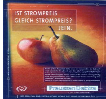
Fig. 29 : wie Äpfel und Birnen

En revanche, cette relation est loin d'être aussi évidente pour les mêmes étudiants au sein de la publicité allemande suivante (fig. 29). En effet, les vehicule properties attribuées à une pomme et une poire ne sont a priori pas ceux de « différence fondamentale » en fonction du sens de l'EI wie Äpfel und Birnen sein/Äpfel mit Birnen vergleichen (« être incomparable en raison d'une nature fondamentalement différente »), mais plutôt ceux de la similitude entre deux fruits qui se ressemblent de surcroît sur la photo. Même dans le contexte d'une publicité pour un fournisseur d'électricité qui affirme que ses prix ne sont pas comparables à travers son slogan, l'établissement d'une relation entre DS et DC n'intervient pas, faute de connaissance de l'EI et de son sens.