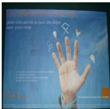
Fig. 7 : du bout des doigts

Aussi la publicité Pro d'Orange , qui comprend l'EI métaphorique « faire qqch du bout des doigts » a effectivement recours à l'image d'une main avec les cinq doigts écartés, un symbole au-dessus de chaque doigt symbolisant une profession différente (fig. 7). Toutefois, aucun lien direct de ce DS avec le DC, « faire qqch très facilement, sans aucun effort », est a priori apparent pour s'imposer au récipiendaire qui ne connaît pas le sens de l'EI.