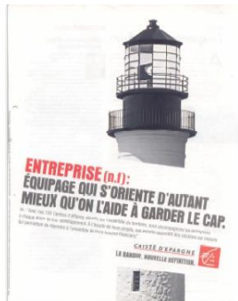
Fig. 13 : garder le cap

Nous parlons de relation implicite entre image matérielle et image linguistique d'une métaphore verbale lorsqu'un lien entre DS – le phare (fig.13) et les ressorts à la place des genoux (fig. 14) – et DC, le sens phraséologique métaphorique de l'EI, peut être établi par l'observateur sur la base de savoirs communs spécifiques. 11