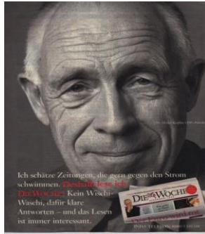
Fig. 21 : gegen den Strom schwimmen

Il en est de même dans les deux publicités allemandes pour l'hebdomadaire Die Woche (fig. 21) et les pâtes Birkel (fig. 22). Les EI gegen den Strom schwimmen (« aller à contre-courant ») de la première, et eine halbe Portion (« une demi-portion ») nécessite des connaissances