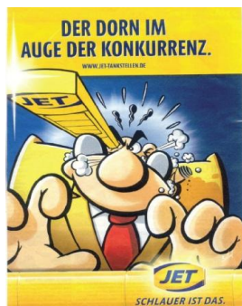
Fig. 15 : Dorn im Auge

Contrairement aux publicités françaises ci-dessus (fig. 13 et 14), les EI ein Dorn im Auge sein (fig. 15), « être vu d'un très mauvais œil par qq'un », et einen guten Riecher haben (fig. 16), « avoir du flair », sont de nature métaphorique puisqu'un lien DS – DC existe. En revanche, dans ce cas-ci, la relation entre image matérielle (DS) et image métaphorique (DC) reste implicite et est interprétable seulement sur la base du slogan et de savoirs