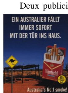
Fig. 9 : mit der Tür ins Haus fallen

aucune façon. Un lien transparent entre DS et DC n'existe pas et n'est pas interprétable pour le récipiendaire qui ne connaît pas le sens de l'EI.