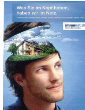
Fig. 4 : etw im Kopf haben

Le corpus allemand comprend le même type de phénomène tout comme notre