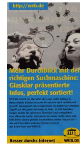
Fig. 10 : Durchblick haben

qu'un. Et le bun (petit pain, petite brioche) dans la publicité de la chaîne de boulangerie Warburtons ne met pas sur la piste de l'EI signifiant être enceinte – à moins qu'on la connaisse.