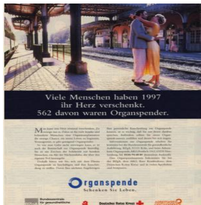
Fig. 30 : sein Herz verschenken

Comme nos analyses l'ont démontré, dans la majorité des publicités, s'il existe un quelconque lien entre DS et DC, l'image dépeint soit le sens littéral, soit un aspect de ce dernier. L'image de la publicité suivante (fig. 30), cas unique dans notre cor-