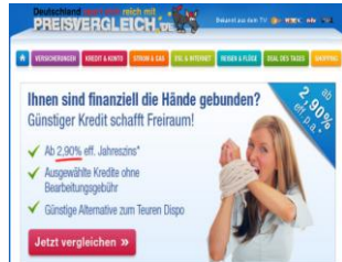
Fig. 3 : jmdm sind die Hände gebunden

La même relation transparente entre DS et DC existe pour l'EI « être à l'étroit » ; l'image montre un homme qui est à l'étroit dans une pièce trop petite pour lui avec des meubles minuscules.