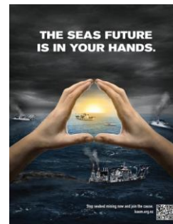
Fig. 6 : be in sb's hands

Dans tous ces cas (fig.1 à 6) l'image maté-