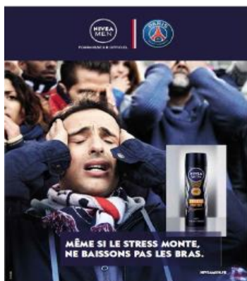
Fig. 25 : ne pas baisser les bras

Le constat final du point 3.4. s'applique a fortiori aux supports publicitaires marqués par une neutralisation du sens métaphorique par l'image, c'est-à-dire des cas où l'image matérielle neutralise le sens métaphorique de l'EI figurant au sein du slogan en exprimant son contraire, où sens phraséologique et sens de l'image matérielle sont par conséquent plus ou moins opposés. Seul un destinataire maîtrisant parfaitement le sens phraséologique de l'image linguistique serait en mesure d'interpréter