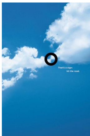
Fig. 17 : hit the road

Un constat similaire s'impose pour la publicité WYG 13 : il existe une