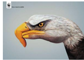
Fig. 11 : give a hand

Les images des publicités pour WWF (fig. 11) et Warburtons (fig. 12) représentent également un élément lexical des EI respectives sans