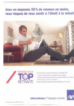
Fig. 2 : être à l'étroit