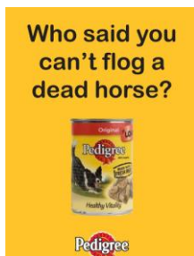
Fig. 23 : flog a dead horse

Pour ce qui est de la relation entre l'EI flog a dead horse , signifiant « ressasser un sujet, se fatiguer en vain, gaspiller son temps pour rien » de la publicité Pedigree (fig. 23) et l'image représentant une boîte de pâtée pour chiens, elle n'existe que dans la mesure où cette boîte peut