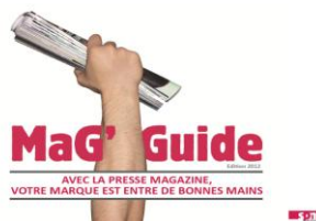
Fig. 8 : entre de bonnes mains

magazine enroulé, mais aucun élément visuel ne pousse à conclure qu'il s'agit d'une « bonne » main. Le sens métaphorique « être pris en charge ou contrôlé par une personne expérimentée, sûre, ou bienveillante » n'est par conséquent dépeinte en